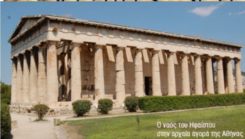
Ο ναός του Ηφαίστου στην αρχαία αγορά της Αθήνας