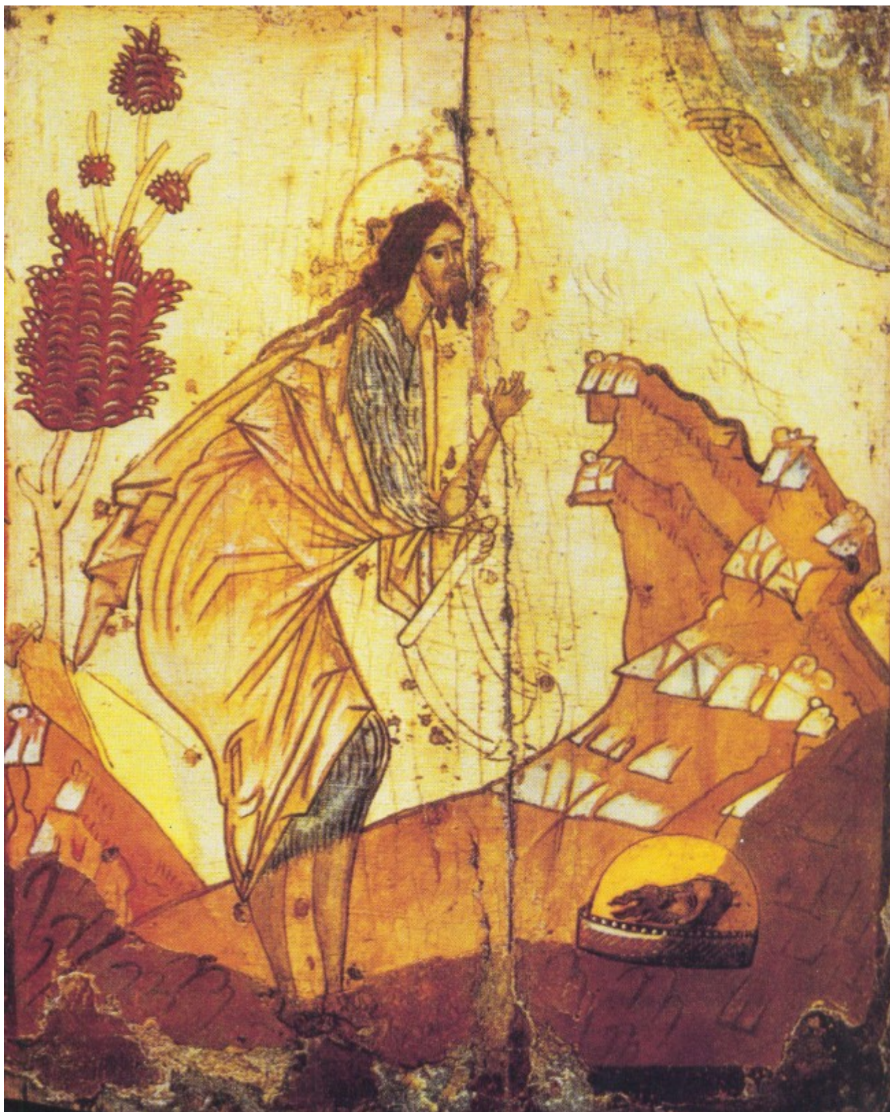
Του Σεβασμιότατου Μητροπολίτου Αντινόης κ.κ. Παντελεήμονος