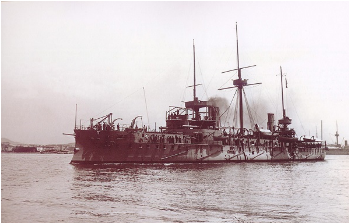
Το θωρηκτό «Ψαρά»

Μόλις κατά την 9η/21 Απριλίου 1897 αναφέρθηκε από το ελληνικό χωριό Τσάγεζι (ονομαζόμενο σήμερα Στόμιο και ευρισκόμενο στις εκβολές του Πηνειού) ότι ο στόλος μας βρισκόταν στον Πλαταμώνα (λίγο δηλαδή βορειότερα από την απόληξη των τότε ελληνοτουρκικών συνόρων στην ακτή του Αιγαίου), όπου το θωρηκτό Ψαρά βομβάρδισε τον εκεί ενετικό πύργο, τον οποίο και ο Κανάρης κανονιοβόλησε με άμεσες και επισκηπτικές βολές (βλ. άρθρο του Υποπλοιάρχου (Ο) Δ.Μ. Γιακουμάκη υπό τον τίτλο Η δραστηριότητα του Β.Ν. κατά τον Ελληνοτουρκικό πόλεμο του 1897, Ναυτική Επιθεώρηση, τεύχ. 305, Ιαν- Φεβρ. 1964, σ. 98).