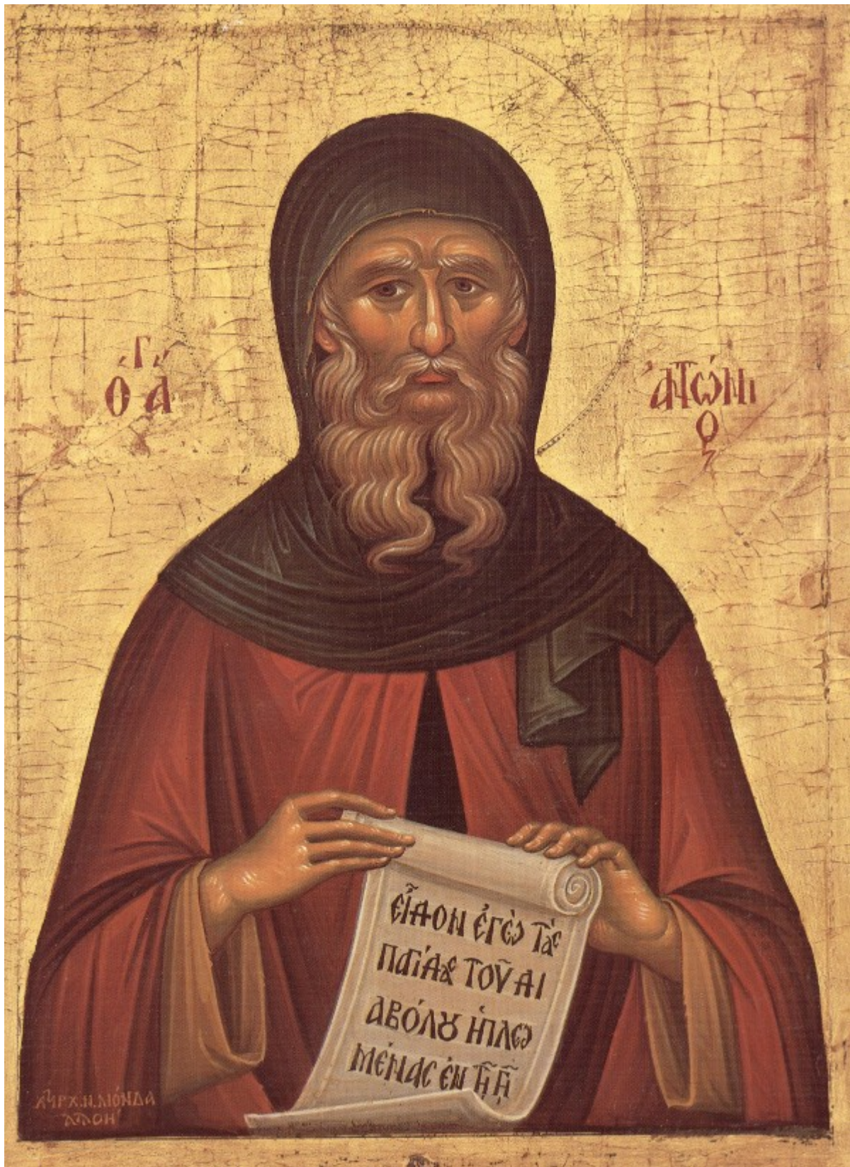
1. Mitropolitul Augustin Kantiotis