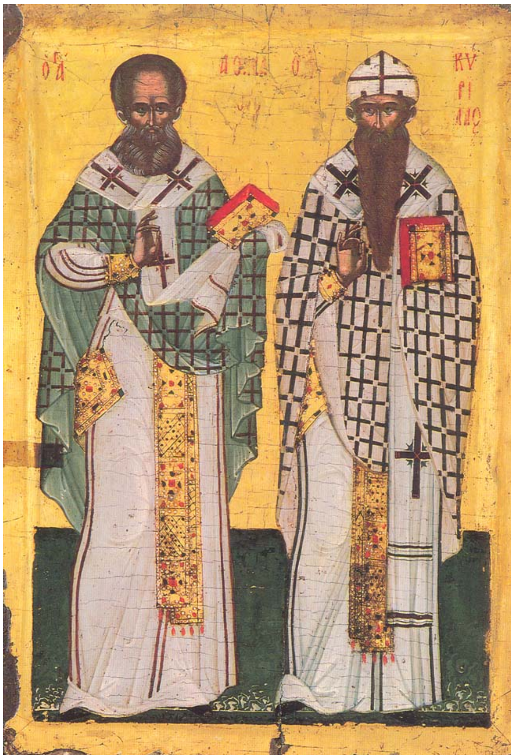
Του Σεβασμιότατου Μητροπολίτη Αντινόης κ.κ. Παντελεήμονα