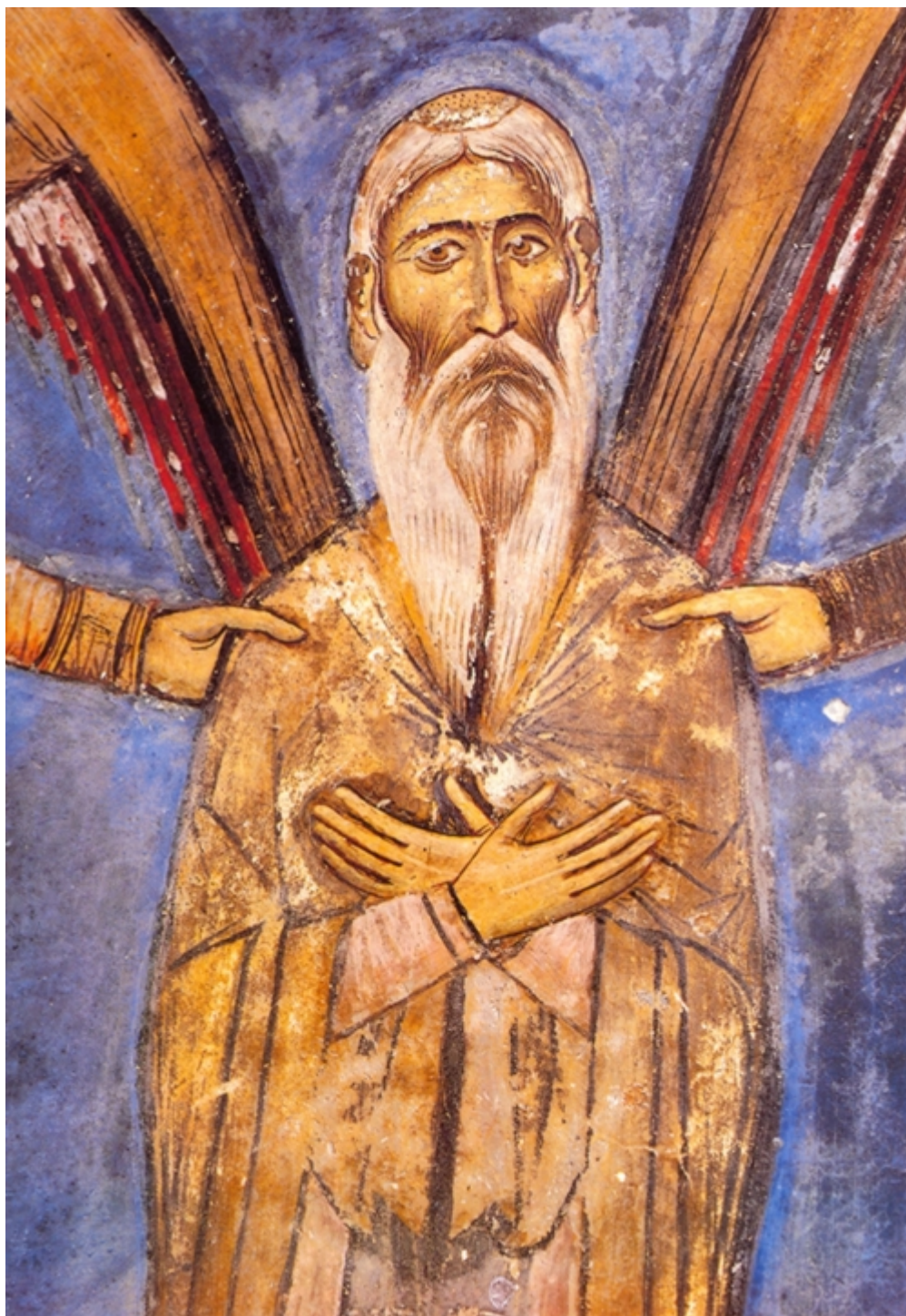
Άγιος Νεόφυτος ο Έγκλειστος. Τοιχογραφία του 1193 (λεπτομέρεια παραστάσεως) η οποία απεικονίζει τον Άγιο βασταζόμενο από δύο Αγγέλους και βρίσκεται στην Έγκλειστρα. Η τοιχογραφία έγινε όταν ο Άγιος ζούσε ακόμη και εικονίζει την επιθυμία του να βασταχθή υπό των Αγγέλων, στην ώρα της εξόδου της ψυχής του.