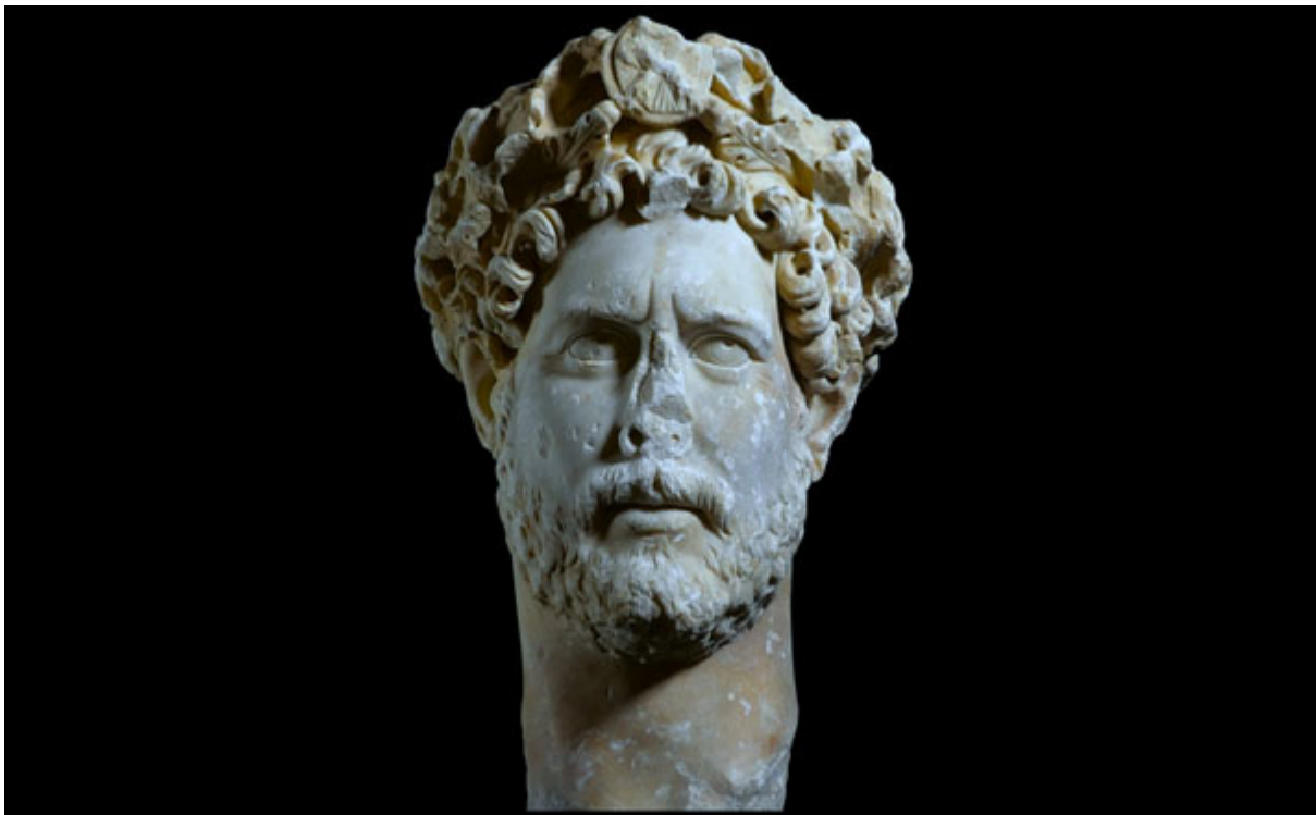
Πορταίτο του αυτοκράτορα Αδριανού. Βρέθηκε στη λεωφόρο Συγγρού. Εθνικό Αρχαιολογικό Μουσείο ΕΑΜ 3729

Το Μουσείο της Ακρόπολης τιμά την επέτειο των 1900 χρόνων από την άνοδο στο θρόνο του φιλαθήναιου αυτοκράτορα Αδριανού με τη μουσειακή παρουσίαση ενός έξοχου πορτραίτου του αυτοκράτορα που είχε βρεθεί στη λεωφόρο Συγγρού και με ένα ενδιαφέρον βίντεο, παραγωγής του Μουσείου, στο οποίο αναδεικνύεται το τεράστιο οικοδομικό πρόγραμμα του αυτοκράτορα για την Αθήνα του 2ου αιώνα μ.Χ. Το έργο του Αδριανού σηματοδοτεί την αναγέννηση των ελληνικών Γραμμάτων και Επιστημών στα χρόνια της Ρωμαϊκής Αυτοκρατορίας.