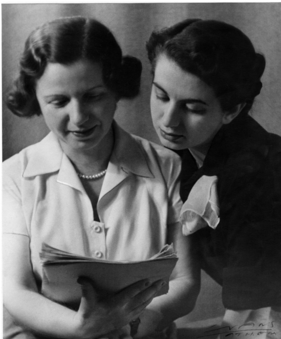
Η Αντιγόνη Μεταξά με την πιο στενή συνεργάτιδά της Λήδα Κροντηρά. 1959.

Η Αντιγόνη Μεταξά γνωστή και αγαπημένη από τους μεγαλύτερους, αλλά άγνωστη στους σημερινούς νέους και στα παιδιά, υπήρξε μια θρυλική μορφή, μία σημαντική παιδαγωγός στην Ελλάδα, που προσέφερε στον τόπο τον πρώτο μόνιμο θεατρικό οργανισμό για παιδιά στην Αθήνα, το «Θέατρο του παιδιού», γράφοντας και ανεβάζοντας παραστάσεις από το 1933 έως το 1941. Η θεία Λένα, είναι όμως γνωστή κυρίως για τις παιδικές ραδιοφωνικές εκπομπές της, στο Εθνικό Ίδρυμα Ραδιοφωνίας.