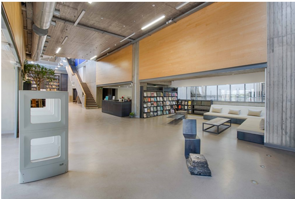
Η Ανωτάτη Σχολή Καλών Τεχνών, βιβλιοθήκη εσωτερικά