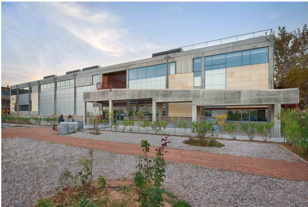
Η Ανωτάτη Σχολή Καλών Τεχνών, Βιβλιοθήκη εξωτερικά

Την εκδήλωση θα χαιρετήσουν οι υπουργοί Παιδείας και Θρησκευμάτων Κώστας Γαβρόγλου και Πολιτισμού και Αθλητισμού κ Λυδία Κονιόρδου.