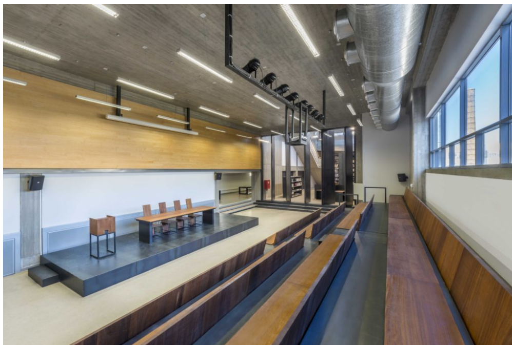
Η Ανωτάτη Σχολή Καλών Τεχνών, βιβλιοθήκη αμφιθέατρο

Η διδασκαλία του, στηριζόταν κυρίως στην ανάλυση της όρασης και στην πλαστική μεταγραφή των δεδομένων της αντίληψης. Το 1930, το Σχολείο των Καλών Τεχνών αναβαθμίστηκε σε Ανωτάτη Σχολή, με την προσωνομία Ανωτάτη Σχολή των Καλών Τεχνών. Την ίδια χρονιά ο γλύπτης Κώστας Δημητριάδης, διορίστηκε από τον Βενιζέλο διευθυντής της Σχολής, θέση που διατήρησε μέχρι το 1943. Με δική του πρωτοβουλία δημιουργήθηκε ο θεσμός των Καλλιτεχνικών Σταθμών. Το 1932, ο Γιάννης Κεφαλληνός διορίστηκε Καθηγητής της Χαρακτικής. Το 1939, θεσμοθετείται επίσημα η έδρα της Ιστορίας της Τέχνης, την οποία κατέλαβε, διαδεχόμενος τον Ζαχαρία Παπαντωνίου, ο λογοτέχνης και ιστορικός της τέχνης Παντελής Πρεβελάκης, που δίδαξε επί 35 χρόνια.