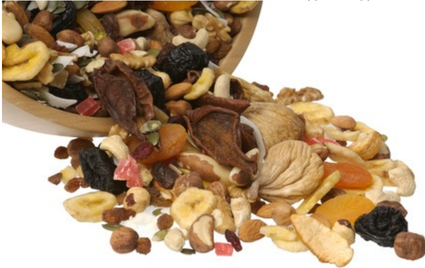
Οι ξηροί καρποί

για χρόνια θεωρούνταν απαγορευτικοί για όσους έκαναν δίαιτα και προσπαθούσαν να διατηρήσουν το βάρος τους. Η άποψη αυτή έχει αρχίσει να καταρρίπτεται τα τελευταία χρόνια, καθώς όλες οι τελευταίες έρευνες αποδεικνύουν ότι οι ξηροί καρποί ανήκουν στην κατηγορία των φυτικών τροφίμων, έχουν ελάχιστα κορεσμένα λιπαρά και χαμηλή περιεκτικότητα σε υδατάνθρακες.