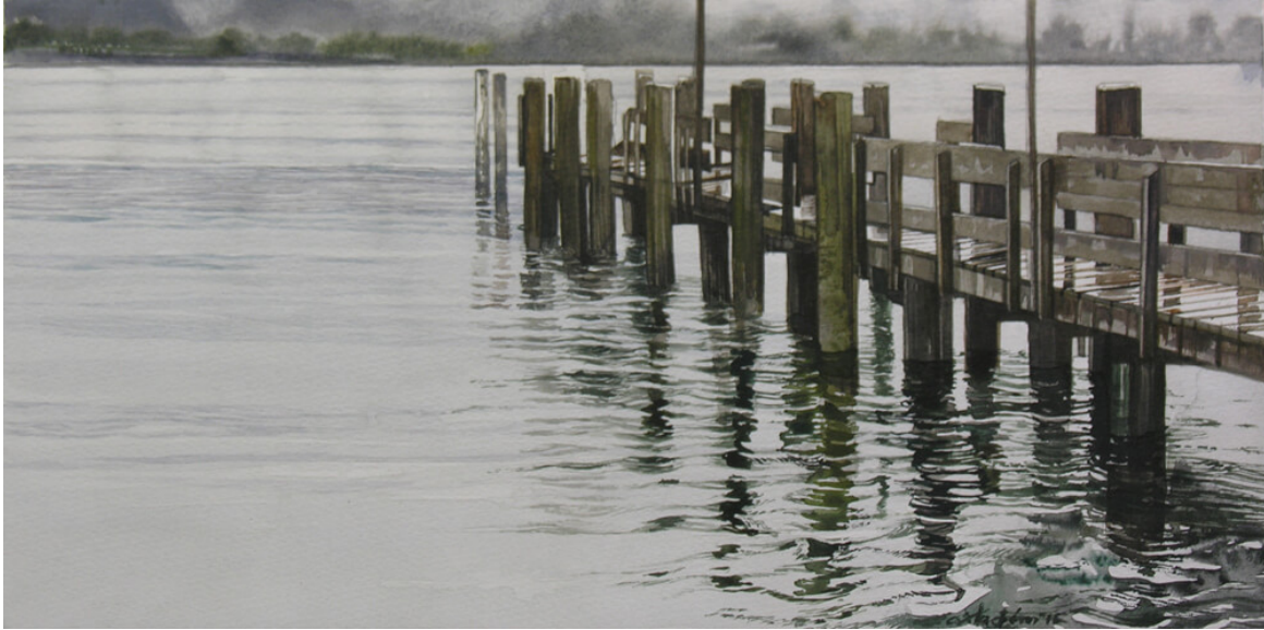
Σαλταφέρως Γιώργος, Ιδεασμός. Ακουαρέλα 20Χ40

μνημονεύει το παρελθόν σε όλες τις στιγμές του, χωρίς να αφήνει τίποτα εκτός.