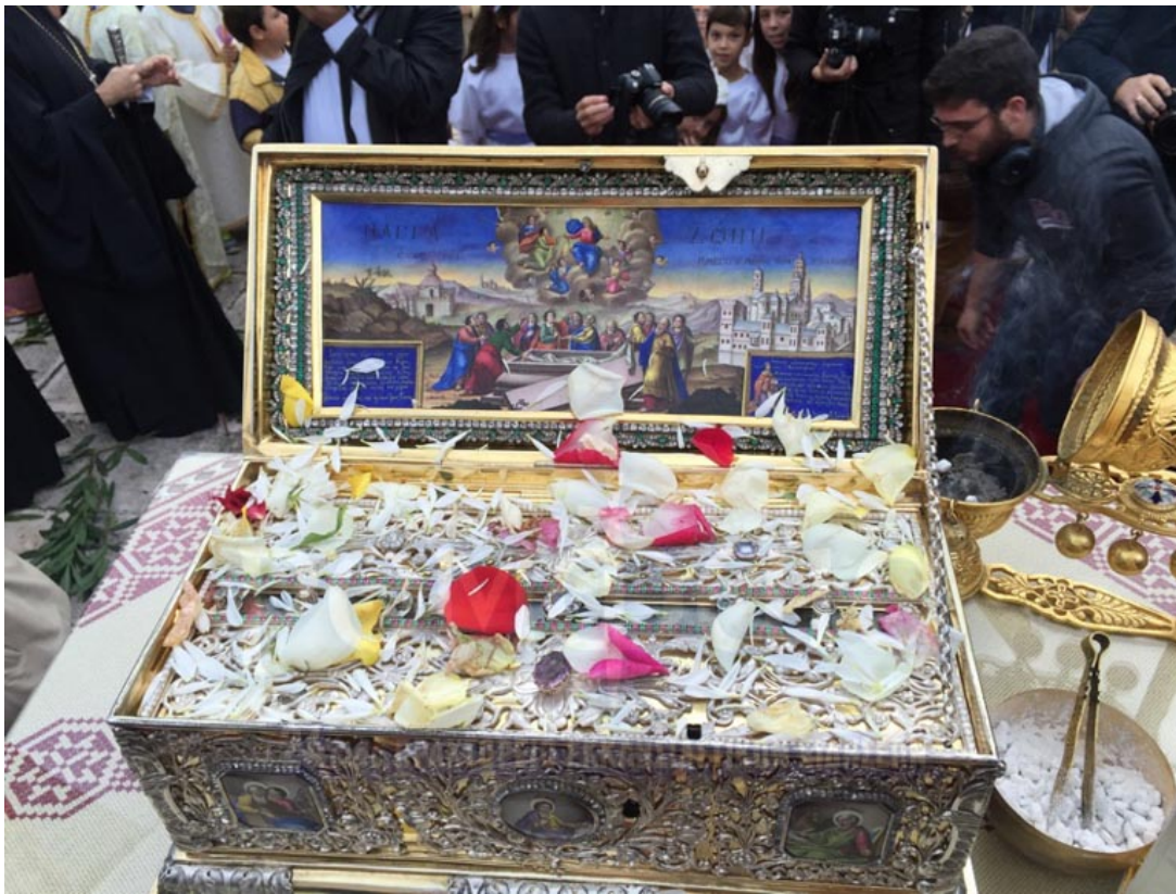
La Sainte Ceinture de la Mère de Dieu

La vie spirituelle authentique dans un repentir constant et une participation régulière aux sacrements de l'Église orthodoxe doit se poursuivre durant toute la vie, parce que c'est notre seul moyen de communion et d'union avec Dieu dans le siècle présent et le siècle futur.