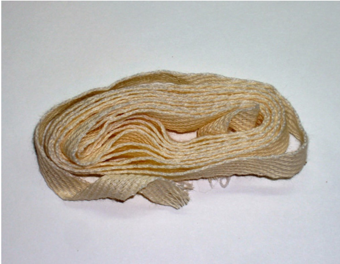
Das beiliegende Band ist gesegnet mit dem Heiligen Gürtel der allerheiligsten Muttergottes, der sich seit dem 14. Jahrhundert als Geschenk des byzantinischen Kaisers Johannes Kantakuzenos im Kloster Vatopaidi befindet.

Es gibt eine alte Tradition, diese Bänder an fromme Pilger zu geben, und durch die Gnade der allerheiligsten Muttergottes, der unser Kloster geweiht ist, sind viele Wunder durch sie geschehen. Krebsleidende und andere Kranke haben durch sie ihre Gesundheit wiedergefunden, und vor allem haben zahlreiche kinderlose Ehepaare mit ihrer Hilfe Kinder erhalten.