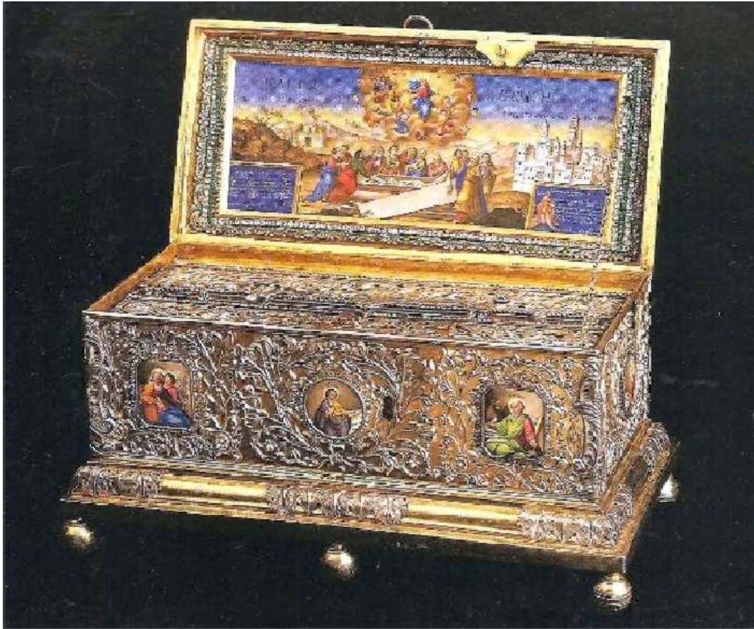
ყოვლადწმიდა ღმრთისმშობლის წმიდა სარტყელი

სულიერი ცხოვრება გამუდმებული სინანულითა და ეკლესიის საიდუმლოებებში მონაწილეობის მიღებით, რაღა თქმა უნდა, საჭიროა მთელი ცხოვრების მანძილზე გრძელდებოდეს, რადგან იგი წარმოადგენს ერთადერთ საშუალებას ღმერთთან ურთიერთობისა და ერთობისათვის, როგორც აწინდელ ისე მომავალ საუკუნოვან ცხოვრებაში.