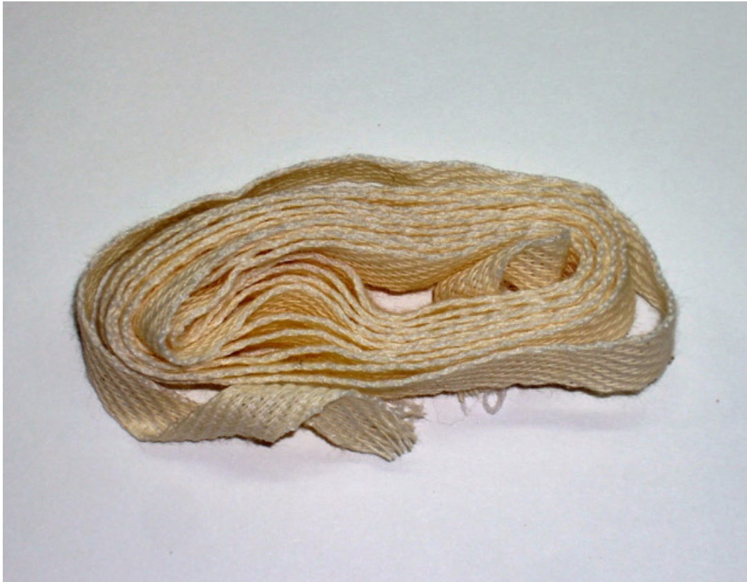
ეს სარტყელი ნაკურთხია ყოვლადწმიდა ღმრთისმშობლის წმიდა სარტყელით, რომელიც ათონის მთის ვატოპედის მონასტერში XIV-ე საუკუნიდან ინახება. იგი შეწირულია ბიზანტიის იმპერატორ იოანე კანტაკუზელის მიერ.

ძველი გადმოცემის მიხედვით ამგვარი სარტყელი ურიგდებოდათ ღმრთისმშობიშ მომლოცველებს და ყოვლადწმიდა ღმრთისმშობლის მადლით, რომლის სახელობისაც არის ჩვენი მონასტერი, აღსრულებულა მრავალი სასწული: კურნება მიმადლებიათ კიბოთი და ასევე სხვა სნეულებებით დაავადებულებს, უმეტესად კი მრავალი უშვილო ცოლ-ქმარი მშობლები გამხდარან.