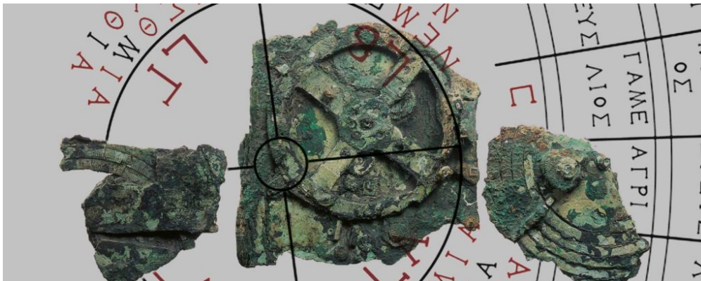
Μηχανισμός των Αντικυθήρων

Στο Μουσείο Ηρακλειδών, (Κτίριο Απ. Παύλου 37, Θησείο) και μέχρι την Κυριακή 28 Μαΐου, φιλοξενείται η έκθεση «Πλεύσις», η οποία αποτελεί ένα νοητό ταξίδι στην ελληνική ναυπηγική και ναυσιπλοΐα από την αρχαιότητα έως τις αρχές του 20ού αιώνα, μέσα από χειροποίητα ξύλινα ομοιώματα πλοίων, έργα τέχνης, όργανα ναυσιπλοΐας, εποπτικό υλικό, χάρτες, βιντεοπροβολές, σχεδιαστικές επεξηγηματικές αναπαραστάσεις και ειδικές εκδόσεις.