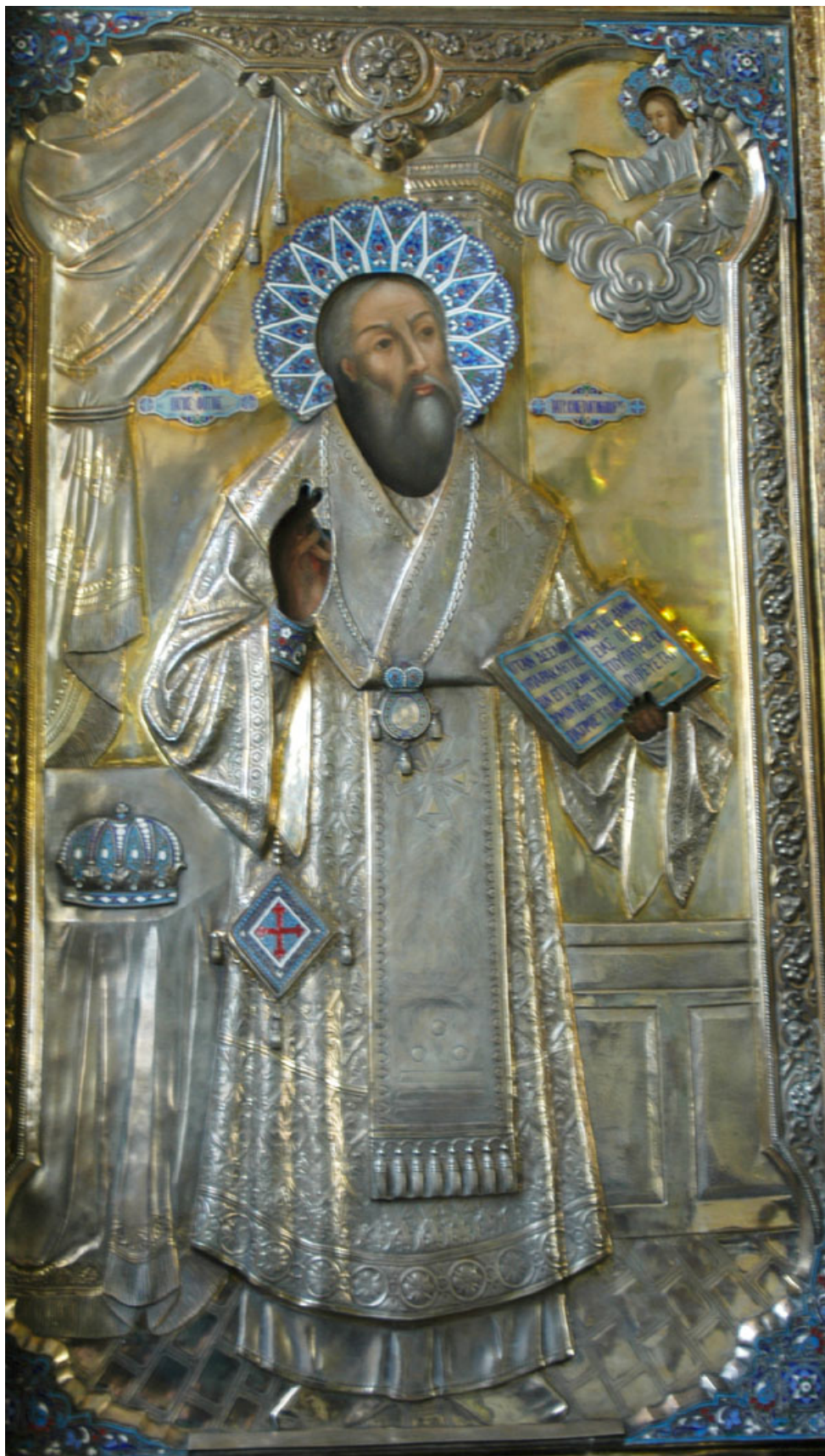
Ρωσική εικόνα του αγίου Φωτίου.