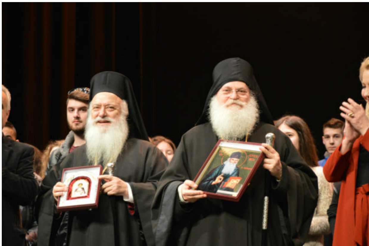
Ήταν μια συγκινητική εκδήλωση όπου τα μέλη των οικογενειών πήραν την ευχή ...ν όχι η ...ους όχι