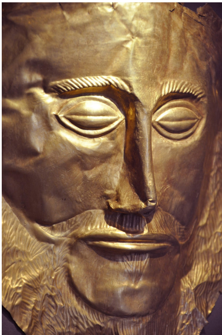
Χρυσή νεκρική προσωπίδα, γνωστή με τη συμβατική ονομασία «μάσκα του Αγαμέμνονα». Από τον Ταφικό Κύκλο Α των Μυκηνών, 16ος αι. π.Χ.

Η πρόσκληση αφορά μια γνωριμία με τις μόνιμες εκθέσεις των προϊστορικών και αιγυπτιακών αρχαιοτήτων, μέσα από τις θεματικές που αναδεικνύουν οι «Οδύσσειες»: ταξίδια στις θάλασσες της ανατολικής Μεσογείου, μυθικές περιπέτειες σε τόπους μακρινούς, ισχυρούς βασιλιάδες και εμπορικές δραστηριότητες. Όλα αυτά θα ζωντανέψουν μέσα από τις αφηγήσεις αρχαιολόγων, της «Συλλογής Προϊστορικών, Αιγυπτιακών, Κυπριακών και Ανατολικών Αρχαιοτήτων». Ο περίπατος θα καταλήγει στην έκθεση «Οδύσσειες».