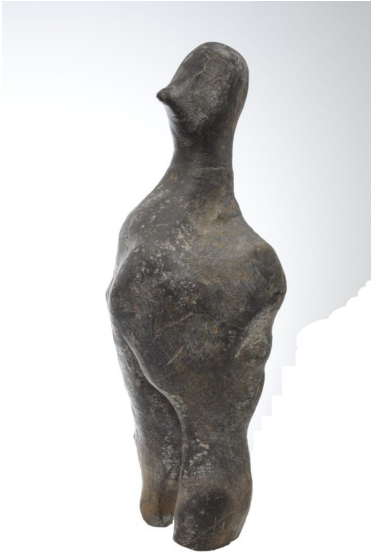
«Ένα Αίνιγμα 7000 χρόνων»: λίθινη ανθρώπινη μορφή της τελικής νεολιθικής περιόδου

Στις 10 και 19 Φεβρουαρίου και στις 10 και 19 Μαρτίου στις 13.00μ.μ., αρχαιολόγοι του Μουσείου θα υποδέχονται τους επισκέπτες στο χώρο της έκθεσης και θα συνομιλούν μαζί τους για τους τρόπους απόδοσης της ανθρώπινης μορφής στους νεολιθικούς χρόνους και για τις πολύπλευρες και άγνωστες σημασίες των ειδωλίων στις πρώιμες κοινωνίες του ελλαδικού χώρου.