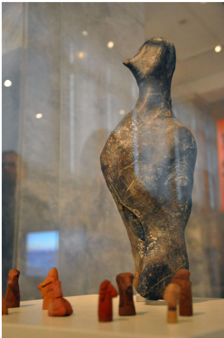
«Ένα Αίνιγμα 7000 χρόνων»: λίθινη ανθρώπινη μορφή της τελικής νεολιθικής περιόδου

Μετά από τα έντεκα θαυμάσια αντικείμενα που ήρθαν στο φως της έκθεσης έως τώρα, το Αθέατο Μουσείο υποδέχεται «ένα αίνιγμα 7000 χρόνων». Πρόκειται για ένα μοναδικό σε μέγεθος έργο γλυπτικής, της τελικής νεολιθικής περιόδου, που αποδίδει αινιγματικά την ανθρώπινη μορφή. Το «αίνιγμα 7000 χρόνων», αναδύθηκε την Δευτέρα 30 Ιανουαρίου, στην «αίθουσα του βωμού» (αιθ.34), για να παραμείνει εκεί ως την Κυριακή 26 Μαρτίου 2017.