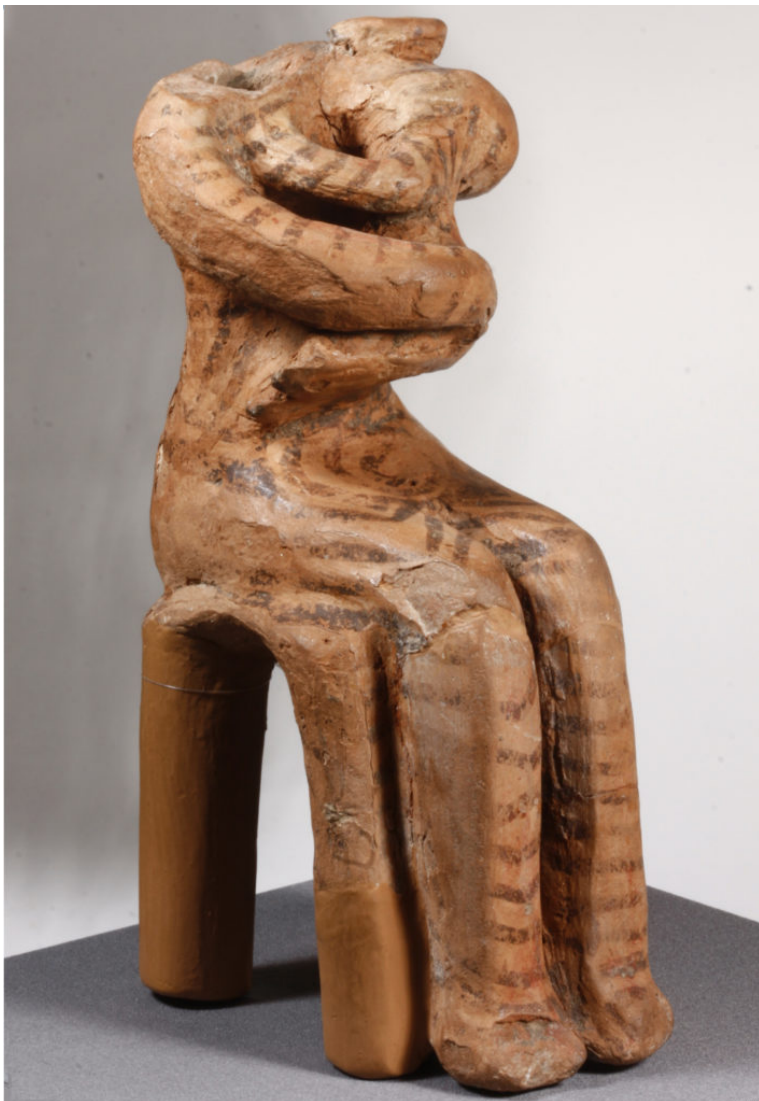
«Η Κουροτρόφος». Πήλινο νεολιθικό ειδώλιο από το Σέσκλο Θεσσαλίας, 4800-4500 π.Χ.

Ένα νέο κύκλο κυριακάτικων περιπάτων, οργανώνει τη δεύτερη Κυριακή κάθε μήνα, στις 12.00 π.μ., το Εθνικό Αρχαιολογικό Μουσείο, στο πλαίσιο των δράσεων που συνοδεύουν την επετειακή έκθεση «Οδύσσειες».