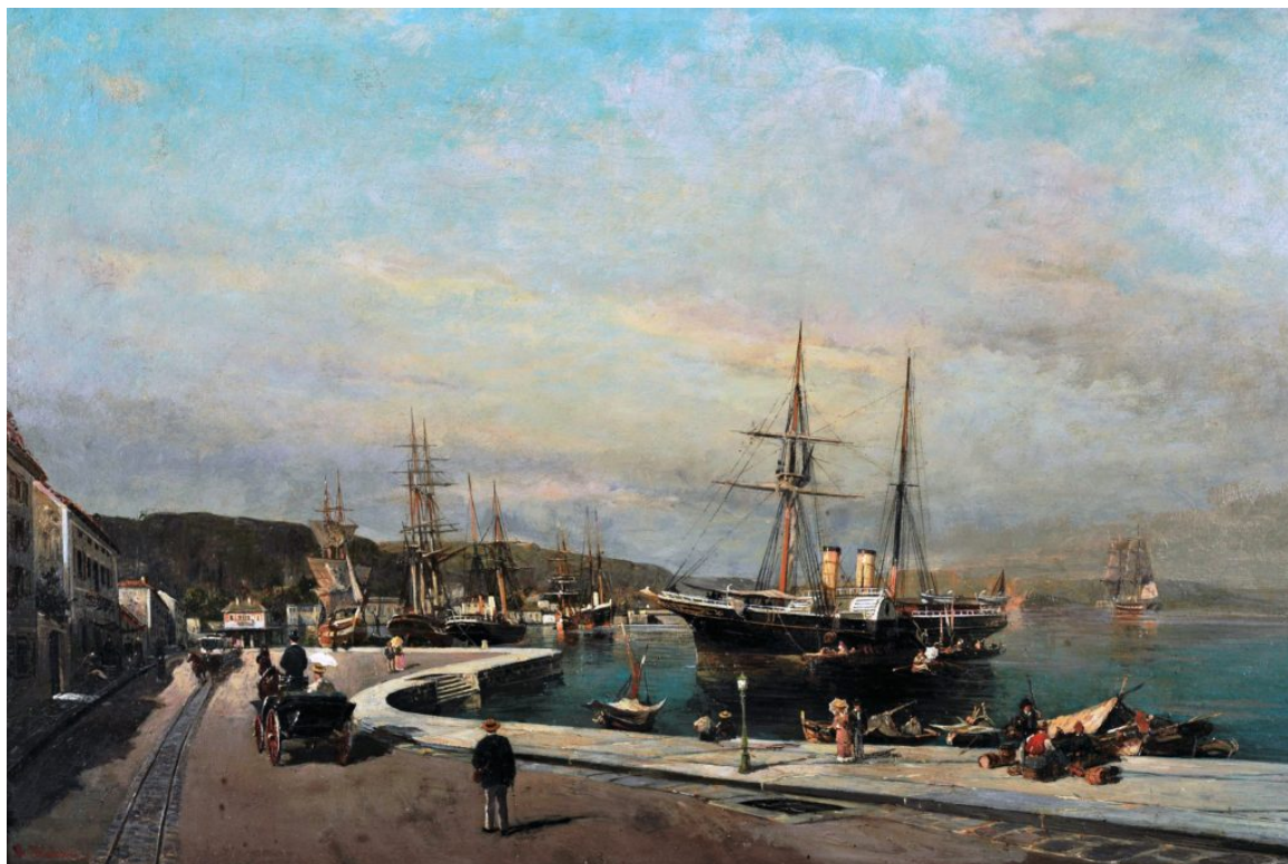
Το λιμάνι του Βόλου Κωνσταντίνος Βολανάκης Λάδι σε ξύλο, 32,5 x 48 εκ. Εθνική Πινακοθήκη και Μουσείο Αλεξάνδρου Σούτζου Αρ. έργου 2620

«Παρά θίν' αλός[2]. Θαλασσινά Θέματα στη Νεοελληνική Ζωγραφική. Από τις συλλογές της Εθνικής Πινακοθήκης και του Ιδρύματος Ε. Κουτλίδη», επιγράφεται η νέα έκθεση του Ιδρύματος Θεοχαράκη, η οποία θα εγκαινιαστεί στις 15 Φεβρουαρίου, από την Υπουργό Πολιτισμού, Λυδία Κονιόρδου και θα διαρκέσει έως τις 7 Μαΐου.