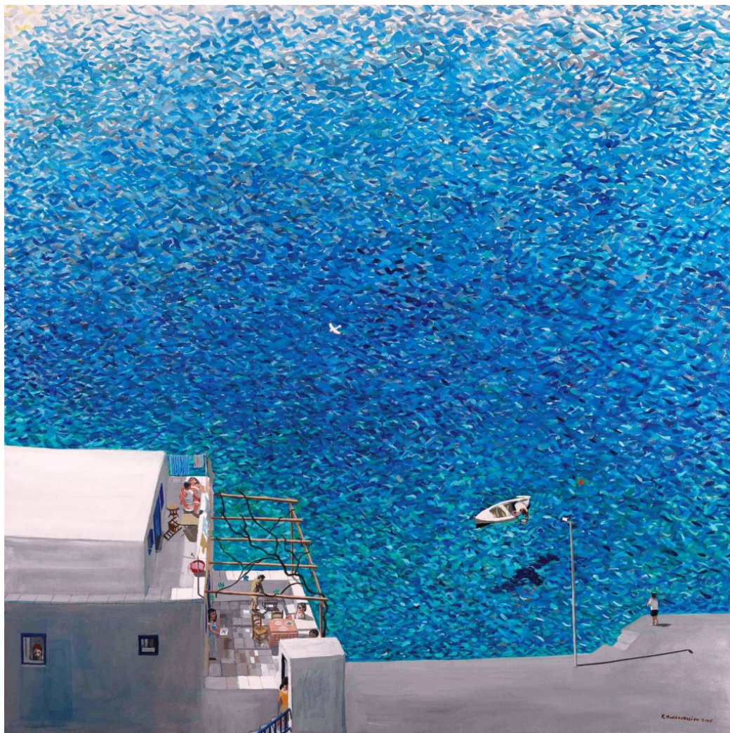
Βάρκα με τη σκιά της, 2007 Κώστας Παπανικολάου Αβγοτέμπερα σε μουσαμά, 180 x 180 εκ. Συλλογή Σωτήρη Φέλιου

Η έκθεση οργανώθηκε στις τρεις αίθουσες του Ιδρύματος Θεοχαράκη, ακολουθώντας μια διαδοχική εξέλιξη της ελληνικής θαλασσογραφίας από τον 19ο αιώνα στον 20ό αιώνα και διαρθρώνεται σε τρεις ενότητες, βάσει των μορφολογικών στοιχείων που τις διακρίνουν. Η σύντομη αυτή αναδρομή και οι αναφορές σε έργα Ελλήνων καλλιτεχνών, αποτελεί μια προσπάθεια εικαστικής περιήγησης και γενικής θεώρησης της εξέλιξης της θαλασσογραφίας στη νεοελληνική τέχνη, μέσα από τις συλλογές της Εθνικής Πινακοθήκης και του Ιδρύματος Ευριπίδη Κουτλίδη.