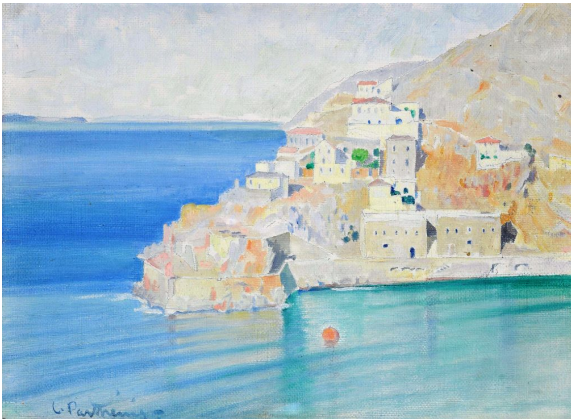
Υδρα, 1918-1920 Κωνσταντίνος Παρθένης Λάδι και μολύβι σε χάρντμπορντ, 23 x 31 εκ. Εθνική Πινακοθήκη και Μουσείο Αλεξάνδρου Σούτζου Αρ. έργου 2636