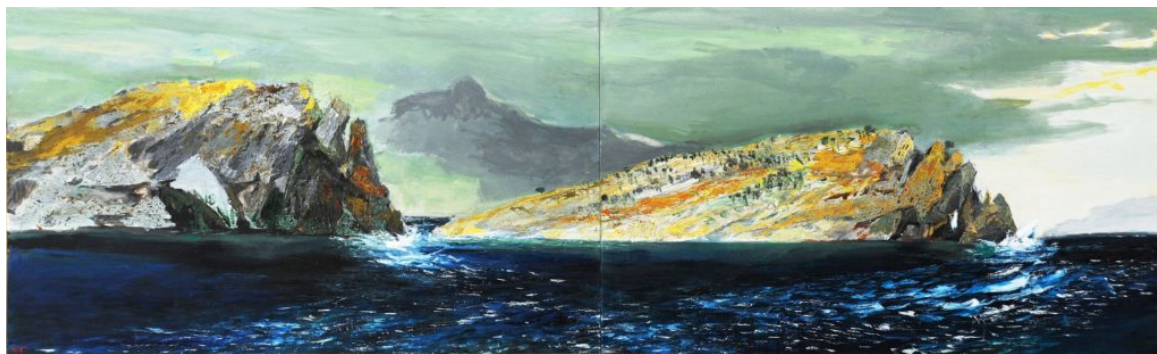
Ακρωτήριο Σκύλαιον II, 2011-2014 Παναγιώτης Τέτσης Λάδι σε μουσαμά, 125,5 x 421 εκ. Εθνική Πινακοθήκη και Μουσείο Αλεξάνδρου Σούτζου Δωρεά του καλλιτέχνη Αρ. έργου 13324

Από αυτήν την περιήγηση, αναδεικνύεται όχι μόνο η εικαστική γραφή των διαφόρων δημιουργών, αλλά και η ανανέωση και η νέα προσέγγιση του θέματος της θάλασσας, από τους σύγχρονους καλλιτέχνες. Τα θαλασσινά θέματα διατρέχουν όλη την ιστορία της νεοελληνικής τέχνης, αναδεικνύοντας την κομβική σημασία του Αιγαίου, στον προσδιορισμό της ελληνικής ταυτότητας και επιβεβαιώνοντας τον Οδυσσέα Ελύτη πως η θάλασσα είναι η κληρονόμος της ελληνικής παράδοσης.»