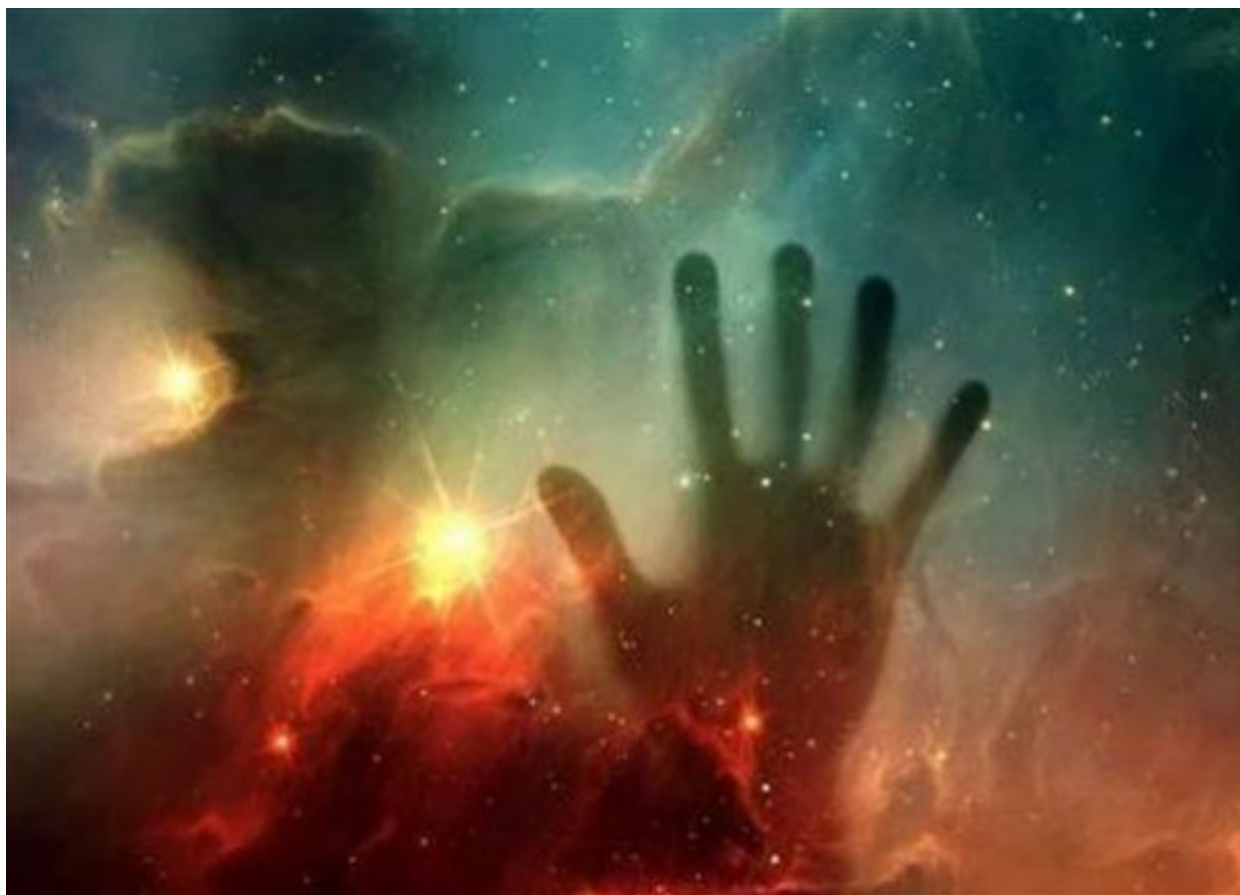
Μυστηριώδη κοσμικά χέρια σπρώχνουν το Σύμπαν σε αντίθετες κατευθύνσεις

Κάποια δύναμη τον τραβάει σε μια κατεύθυνση και μια άλλη τον απομακρύνει από εκεί