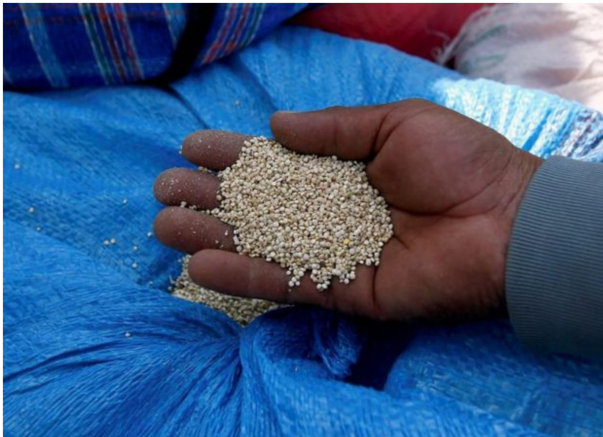
FILE PHOTO - A man holds quinoa grains at a marketplace for small and medium-sized quinoa growers in Challapata, Oruro Department, south of La Paz, Bolivia on April 19, 2014.

Η κινόα ( Chenopodium quinoa ) είναι ένας θάμνος του οποίου οι σπόροι τρώγονται και ανήκει στα λεγόμενα ψευδοδημητριακά