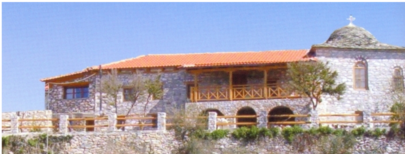
Ιερά Καλύβη Αγίου Ιωάννου Θεολόγου. Νέα Σκήτη Αγίου Όρους