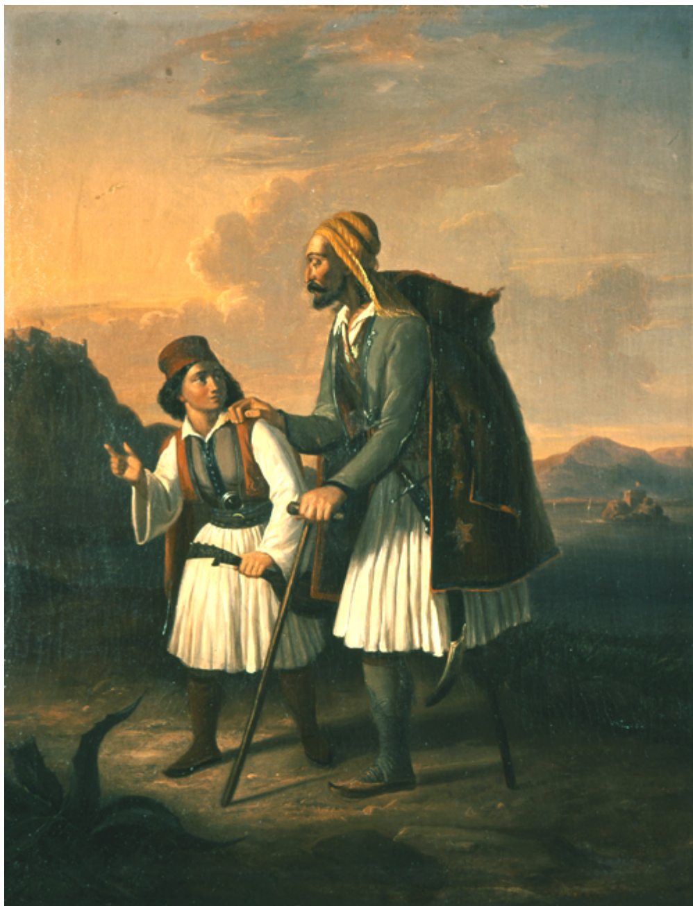
Θεόδ. Βρυζάκης: Το τυφό παλληκάρι

Για να επιστρέψουμε στην Θεσσαλονίκη και την Μακεδονία σημειώνουμε την ψυχική διάθεση των Μακεδόνων και των Θεσσαλονικέων ότι πλησίαζε η ώρα της ελευθερίας, όταν έμαθαν ότι με την πρώτη ελληνοτουρκική εμπορική συμφωνία, έφθασε στην Θεσσαλονίκη ο πρώτος Έλληνας πρόξενος Θεόδωρος Βαλλιάνος το 1835. Τα χρόνια περνούσαν και οι Θεσσαλομακεδόνες επαναστάτησαν δύο φορές μές σε 20 χρόνια. Την πρώτη φορά το 1854, αλλά και λίγο πριν με την δράση των κλεφταρματολών Διαμαντή και Πιτσάβα, Γκούντροβο, Χαρίση, Ζέρβα. Την δεύτερη το 1878, όταν οι Πανσλαβιστές του κόμητος Ιγνάτιεφ δημιούργησαν επί χάρτου βέβαια την Μεγάλη Βουλγαρία με την συνθήκη του Αγίου Στεφάνου, όταν οι νικητές Ρώσοι του ρωσοτουρκικού πολέμου 1876 - 1878 επέβαλαν την συνθήκη