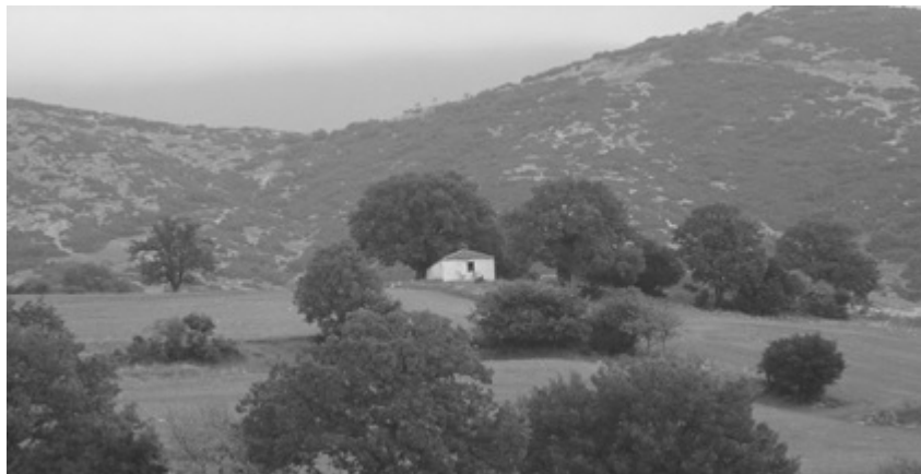
Το εξωκλήσι των κοκκινοπλίτικων αμπελιών, όπως είναι σήμερα.