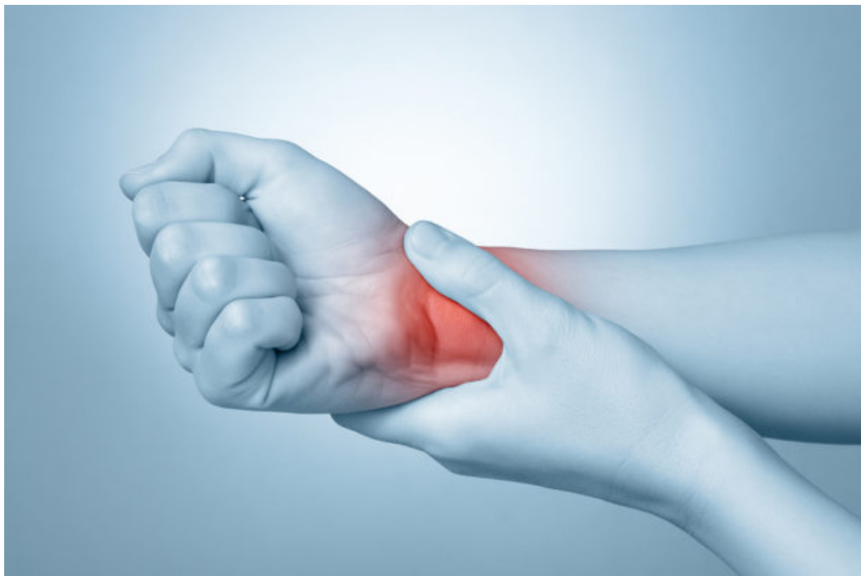
A young woman touching her painful wrist

Οι ερευνητές της ιατρικής σχολής του πανεπιστημίου του Σαν Ντιέγκο της Καλιφόρνια, ανακάλυψαν ότι μόλις 20 λεπτά άσκησης μέτριας έντασης, όπως είναι το γρήγορο περπάτημα ή το ποδήλατο, οδηγούν σε μια αλληλουχία αντιδράσεων που έχει ως αποτέλεσμα τη μείωση μιας σειράς φλεγμονωδών παραγόντων.