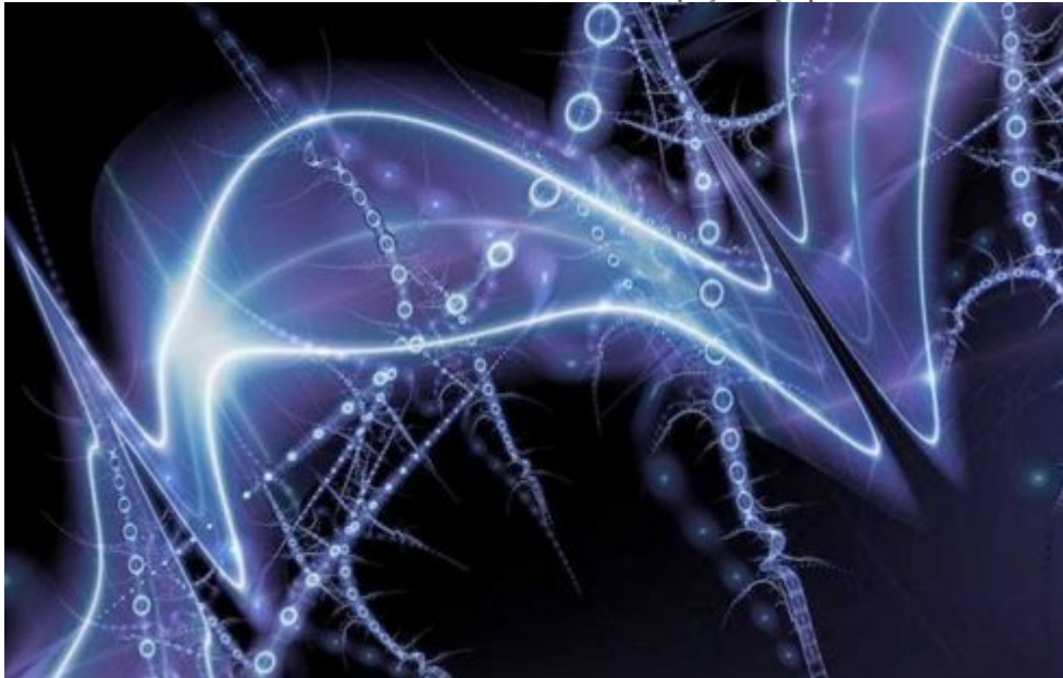
Μία ομάδα βιολόγων

ανακοίνωσε ένα άκρως φιλόδοξο σχέδιο: να «διαβάσει» (αλληλουχίσει) το DNA όλης της ζωής που υπάρχει πάνω στη Γη.