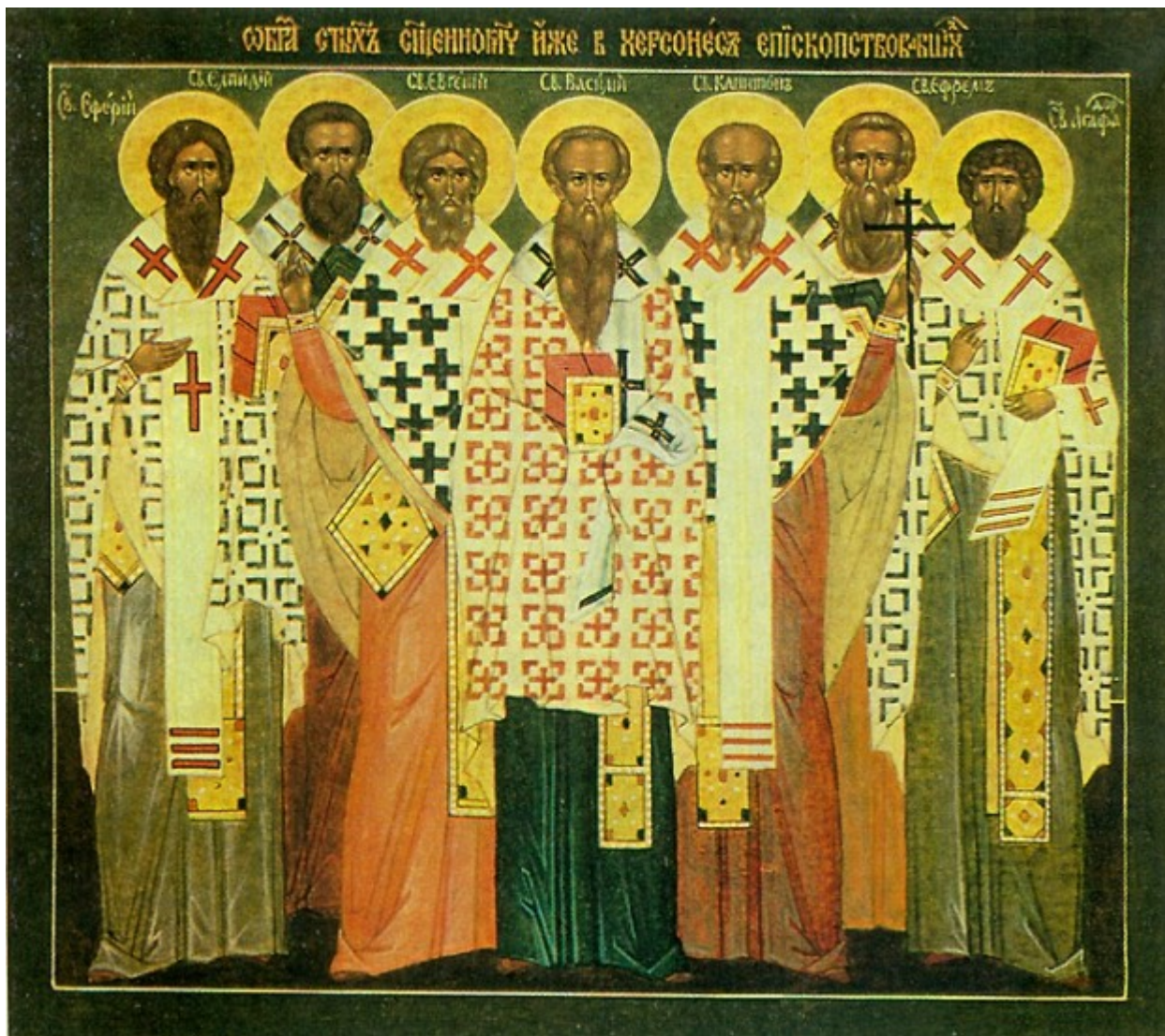
Οι Άγιοι Εφραίμ, Βασιλεύς, Ευγένιος, Αγαθόδωρος, Ελπίδιος, Καπίτων και Αιθέριος