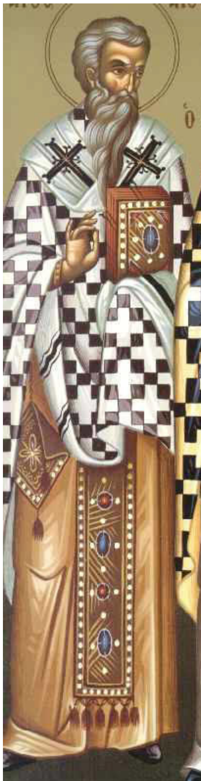
Ο Άγιος Αιθέριος