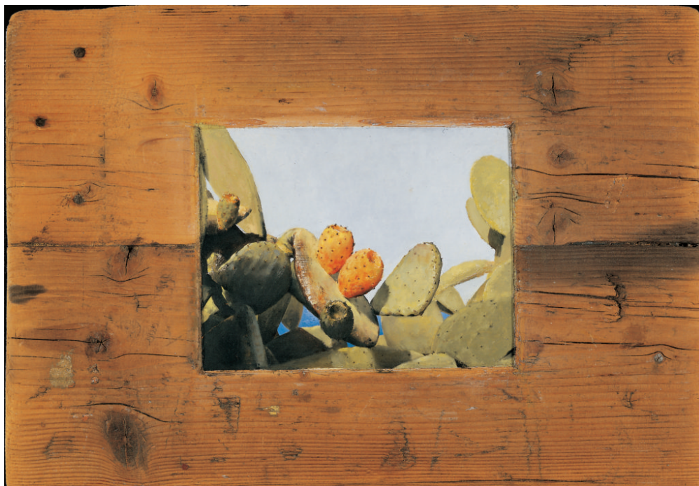
Χρήστος Μποκόρος, Φραγκοσυκιά, ελαιογραφία σε ξύλο, 56Χ40 εκ, 2002

Χρήστου Μποκόρου, τα οποία ανήκουν στη συλλογή της ΑΓΕΤ Ηρακλής και δημιουργήθηκαν ειδικά για το ημερολόγιο της εταιρίας, το 2002, καθώς και άλλα από την προσωπική συλλογή του καλλιτέχνη και από ιδιωτικές συλλογές.