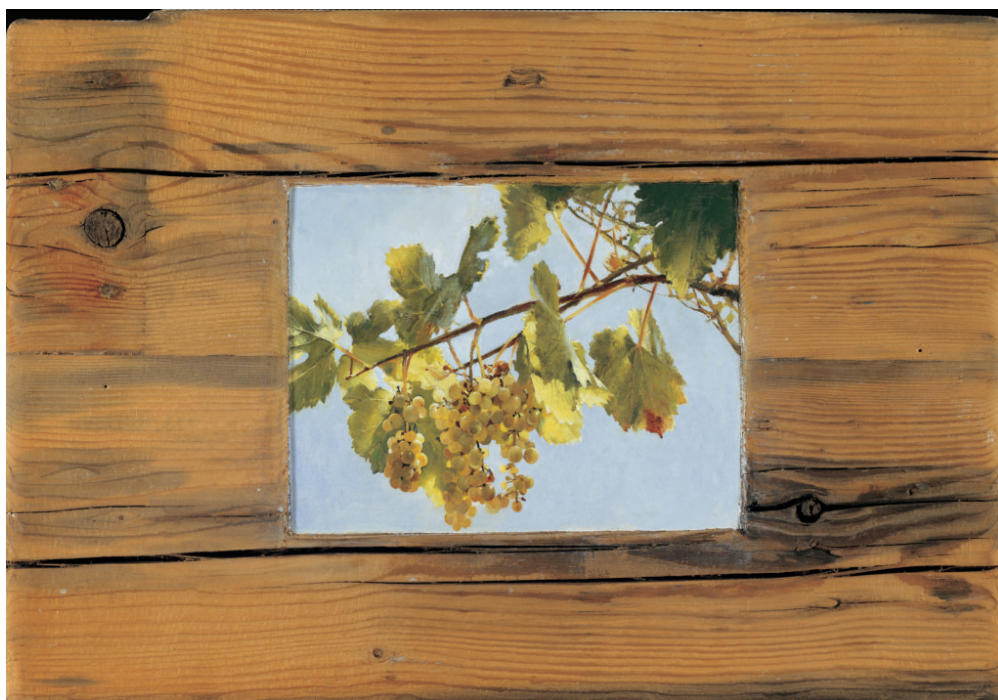
Χρήστος Μποκόρος, Κλήμα, ελαιογραφία σε ξύλο, 56Χ40 εκ, 2002

Η επιλογή της λέξης αυτής, για την νέα έκθεση του Χρήστου Μποκόρου, η οποία θα φιλοξενηθεί στον πρώτο όροφο του κτηρίου της οδού Πειραιώς, σηματοδοτεί αφενός τη σύνδεση με την προηγούμενη έκθεση «Όψεις Αθήλων» και αφετέρου, την επιστροφή στο Μουσείο Μπενάκη του σπουδαίου συνόλου που απαρτίζουν «Τα Στοιχειώδη».