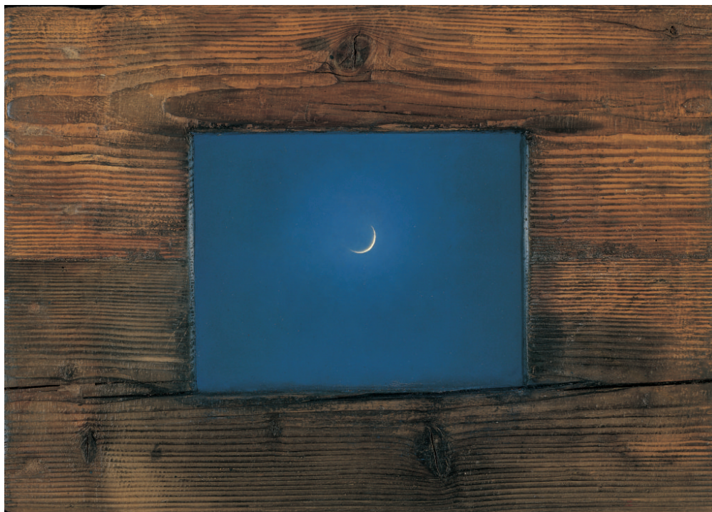
Χρήστος Μποκόρος, Φεγγαράκι, ελαιογραφία σε ξύλο, 56Χ40 εκ, 2002

Ο Χρήστος Μποκόρος γεννήθηκε το 1956 και μεγάλωσε στο Αγρίνιο. Σπούδασε νομικά στο Δημοκρίτειο Πανεπιστήμιο Θράκης και ζωγραφική στην Ανωτάτη Σχολή Καλών Τεχνών της Αθήνας. Τα τελευταία χρόνια ζει και εργάζεται στην Καστέλα. Έχει εκπροσωπήσει πολλές φορές την Ελλάδα και έχει διακριθεί σε διεθνείς διοργανώσεις. Έχει εκθέσει σε πολλές χώρες του κόσμου και έργα του βρίσκονται σε δημόσιες και ιδιωτικές συλλογές, εντός και εκτός της Ελλάδας.