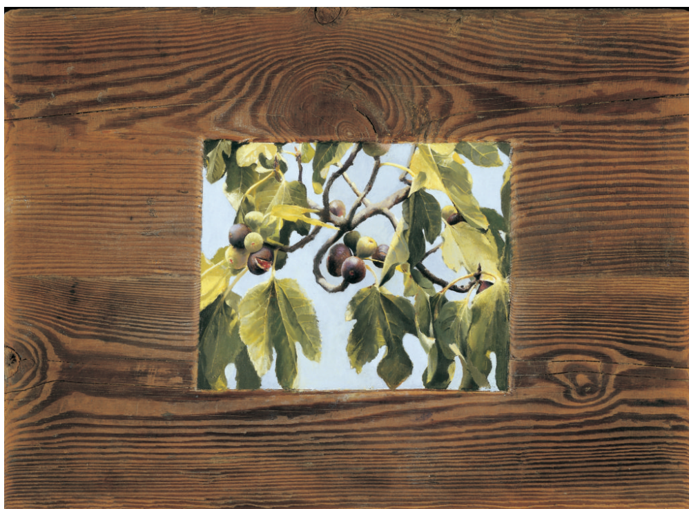
Χρήστος Μποκόρος, Συκιά, ελαιογραφία σε ξύλο, 56Χ40 εκ, 2002

Τίθεται, με τον τρόπο αυτό, μια βάση αυτοπροσδιορισμού ικανή να μεταλαμπαδεύσει το νόημα και τη δυναμική της στον επισκέπτη, ο οποίος μετατρέπεται σε συνοδοιπόρο του καλλιτέχνη και συμμετέχο της τέχνης του, με στόχο την προσωπική του ανάταση.