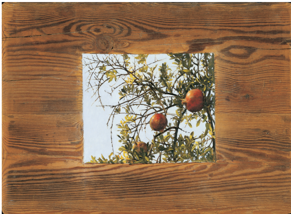
Χρήστος Μποκόρος, Ροδιά, ελαιογραφία σε ξύλο, 56Χ40 εκ, 2002

Τίθεται, με τον τρόπο αυτό, μια βάση αυτοπροσδιορισμού ικανή να μεταλαμπαδεύσει το νόημα και τη δυναμική της στον επισκέπτη, ο οποίος μετατρέπεται σε συνοδοιπόρο του καλλιτέχνη και συμμετέχο της τέχνης του, με στόχο την προσωπική του ανάταση.