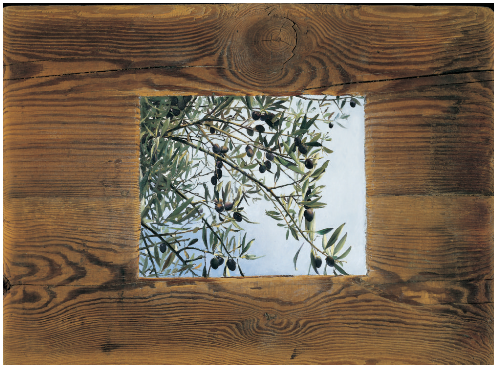
Χρήστος Μποκόρος, Ελιά, ελαιογραφία σε ξύλο, 56Χ40 εκ, 2002

Η επιλογή της λέξης αυτής, για την νέα έκθεση του Χρήστου Μποκόρου, η οποία θα φιλοξενηθεί στον πρώτο όροφο του κτηρίου της οδού Πειραιώς, σηματοδοτεί αφενός τη σύνδεση με την προηγούμενη έκθεση «Όψεις Αθήλων» και αφετέρου, την επιστροφή στο Μουσείο Μπενάκη του σπουδαίου συνόλου που απαρτίζουν «Τα Στοιχειώδη».