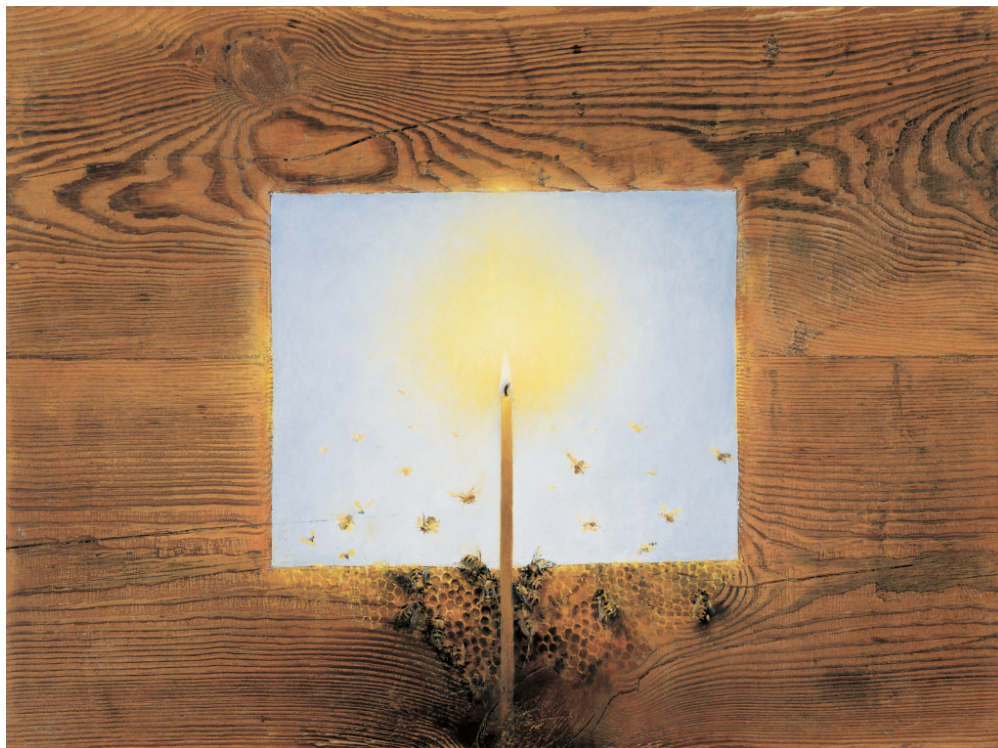
Χρήστος Μποκόρος, Μέλισσες, ελαιογραφία σε ξύλο, 56Χ40 εκ, 2002

Η έκθεση «Νόστος Αθήλων», δεν είναι απλώς μια επανέκθεση των έργων του Χρήστου Μποκόρου σε ένα διαφορετικό χώρο. Προέκυψε, κατά κάποιον τρόπο, ως αναγκαία εξέλιξη μετά τη ανταπόκριση του κοινού στις «Όψεις Αθήλων», αλλά και στην επιθυμία για συνέχιση της σχέσης που χτίστηκε ανάμεσα στον καλλιτέχνη, το Μουσείο Μπενάκη και το κοινό, κατά τη διάρκεια της πρώτης έκθεσης.