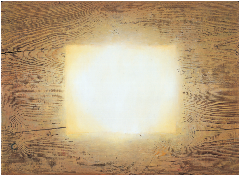
Χρήστος Μποκόρος, Ολόφωτο, ελαιογραφία σε ξύλο, 56Χ40 εκ, 2002

Μετά τη μεγάλη ανταπόκριση του κοινού στην έκθεση του Χρήστου Μποκόρου «Όψεις Αδήλων», το Μουσείο Μπενάκη αποφάσισε να φιλοξενήσει στους χώρους του, στο Κτήριο της οδού Πειραιώς, μία νέα έκθεση έργων του σημαντικού καλλιτέχνη, αυτή τη φορά με τον τίτλο «Νόστος Αδήλων».