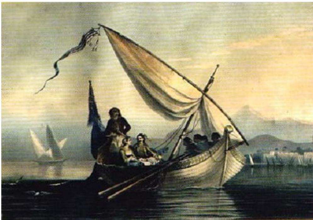
Πίνακας αγνώστου ζωγράφου που φέρει τον τίτλο «η ανατολή μιας καλύτερης μέρας». Εικάζεται ότι ζωγραφίστηκε και ανατυπώθηκε στη Γαλλία, με παραγγελία του Νικόλαου Θησέα. Εικάζεται ακόμα, ότι, στη μορφή του καπετάνιου, προσωπογραφείται ο ίδιος ο Νικόλαος Θησέας. Στο βάθος του πίνακα δεξιά, η Λάρνακα και το Σταυροβούνι. Το τρικάρτο καράβι αριστερά, συμβολίζει την Αγία Τριάδα

Παράλληλα, τη δράση των Κυπρίων αγωνιστών βεβαιώνουν τα Πιστοποιητικά που εξέδωσαν μετά τη λήξη του αγώνα ξακουστοί οπλαρχηγοί της Επανάστασης όπως ο Πετρόμπεης, ο Νικηταράς, ο Κολοκοτρώνης, ο Μακρυγιάννης και άλλοι[2].