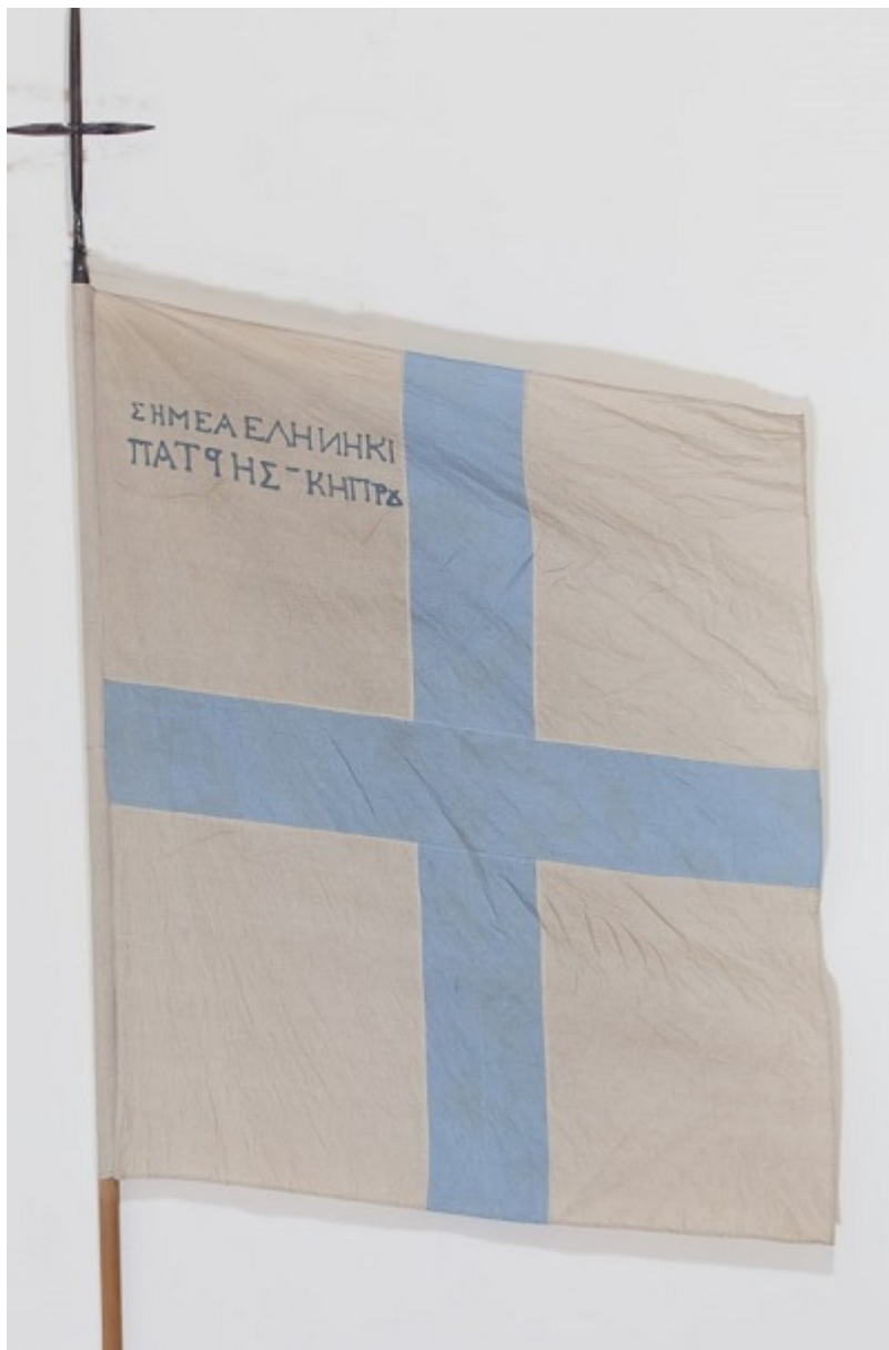
Λάβαρο Κυπρίων εθελοντών του 1821, στο οποίο αναγράφεται: «ΣΗΜΕΑ ΕΛΛΗΝΙΚΙ ΠΑΤΡΗΣ ΚΗΠΡΟΥ» (Εθνικό Ιστορικό Μουσείο Αθηνών)

Ωστόσο, η έναρξη των ένοπλων συγκρούσεων βρήκε και Κύπριους εθελοντές να πολεμούν με τον Ιερό Λόχο, στο πλευρό του Αλέξανδρου Υψηλάντη. Ενώ, λίγο αργότερα ο Κύπριος Ζήνων Αγγελής έπεσε νεκρός μαζί με τον Γιωργάκη Ολύμπιο, στην πολιορκία της Μονής Σέκου στη Μολδαβία.