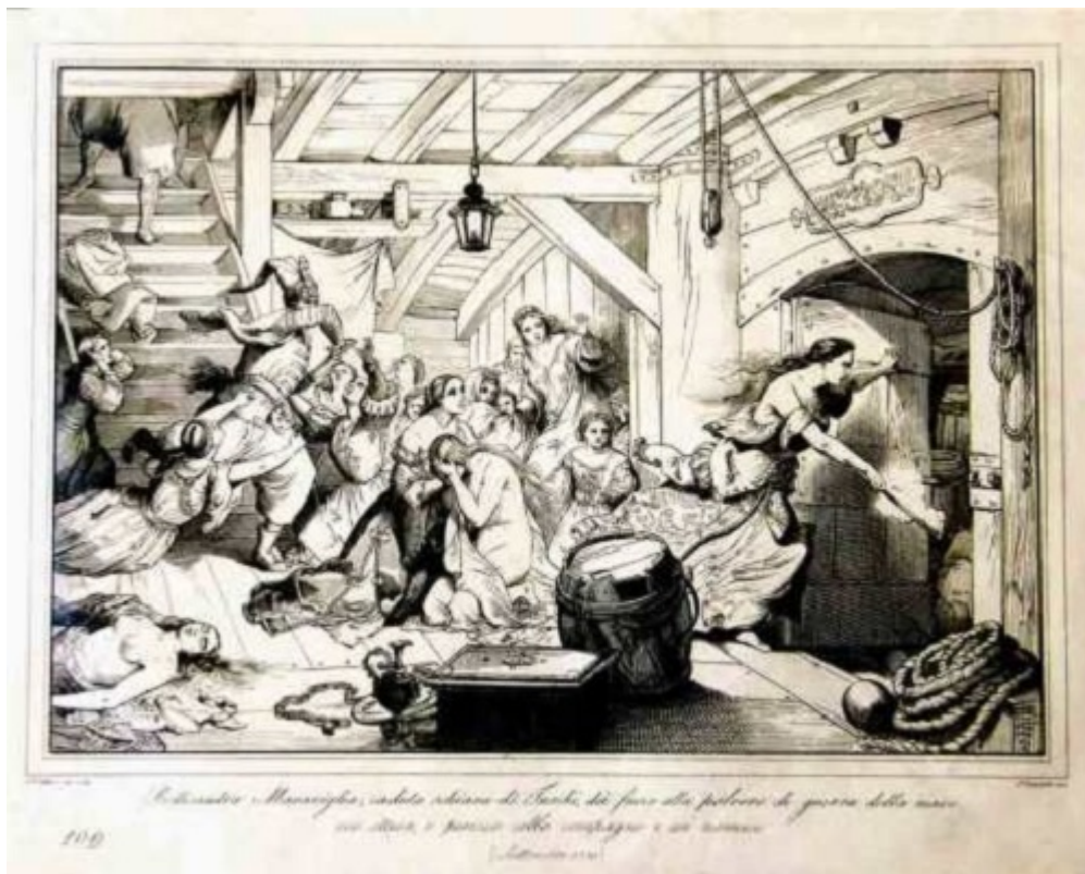
«Η Θυσία της Βελισάνδρας». Σχέδιο 18ου Αιώνα. Η Μαρία Συγκλητική (Αρνάλδα, Ρενάλδα, Βελισάνδρα) ανατινάζει την πυριτιδαποθήκη του πλοίου στο οποίο ήταν αιχμάλωτη μαζί με εκατοντάδες νεαρές Κύπριες. Εμπνεόμενος ο Αντώνιος Μάτεσης, συνδέει υπερβατικά την περιπλανώμενη ψυχή της Ρενάλδας με την μετέπειτα δράση του Πυρπολητή Κωνσταντίνου Κανάρη («Κυπριώτισσα», 1570).

Αρχικά, στην περίπτωση της εθνικής παλιγγενεσίας του 1821 ο φόρος αίματος των Ελληνοκυπρίων (όπως και των λοιπών Ελλήνων) ξεκίνησε να «καταβάλλεται» αιώνες πριν την επανάσταση. Συγκεκριμένα, το έτος 1570, 100.000 τουρκικού στρατού με 360 πλοία εισβάλλουν στην Κύπρο και επιδίδονται σε σφαγές και λεηλασίες υπό τις διαταγές του αιμοσταγούς Μουσταφά πασά. Μητέρες σφάζουν με τα ίδια τους τα χέρια τα παιδιά τους προκειμένου να μην τα αφήσουν σκλάβους στον βάρβαρο εχθρό. Πολλές Κύπριες, για να αποφύγουν τη μαρτυρική ατίμωση των ιδίων και των θυγατέρων τους, επιλέγουν να σκοτωθούν πηδώντας από γκρεμούς. Λίγους αιώνες αργότερα, κάτι ανάλογο θα συμβεί στο Ζάλογγο στην Ήπειρο και στην Αραπίτσα της Νάουσας[8]. Σε 20.000 υπολογίζονται τα θύματα και σε 2.000 οι απαχθέντες δούλοι κατά την τότε τουρκική θηριωδία, εν Κύπρω.