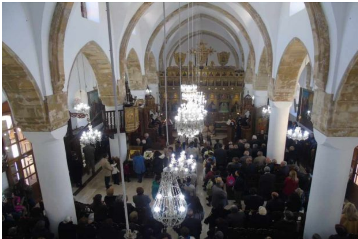
Ε με το πίλα, η