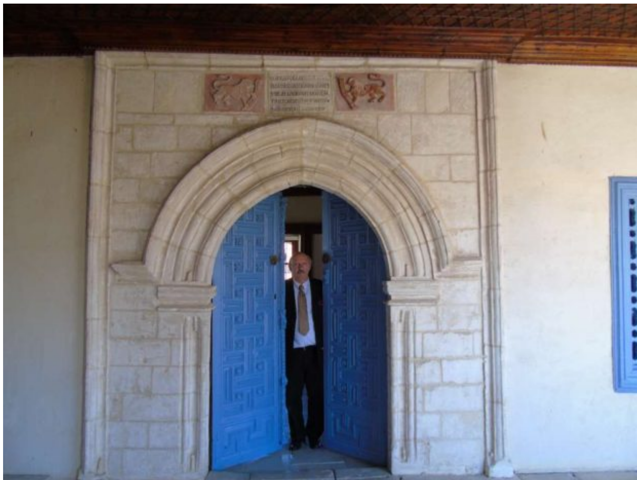
Από το Μεγάλο Συνοδικό της Μονής με τον θαυμάσιο ξυλόγλυπτο Θρόνο - Κρύπη του Τιμίου Σταυρού. Εδώ, που κρατήθηκε «σκλαφκίες ατέλειωτες» (Κώστας