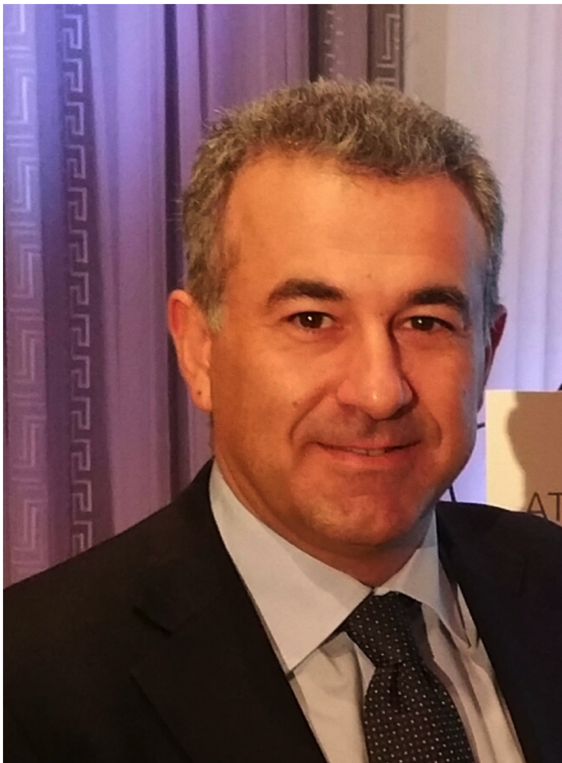
Γράφει ο Ιωάννης Μήτσιος*