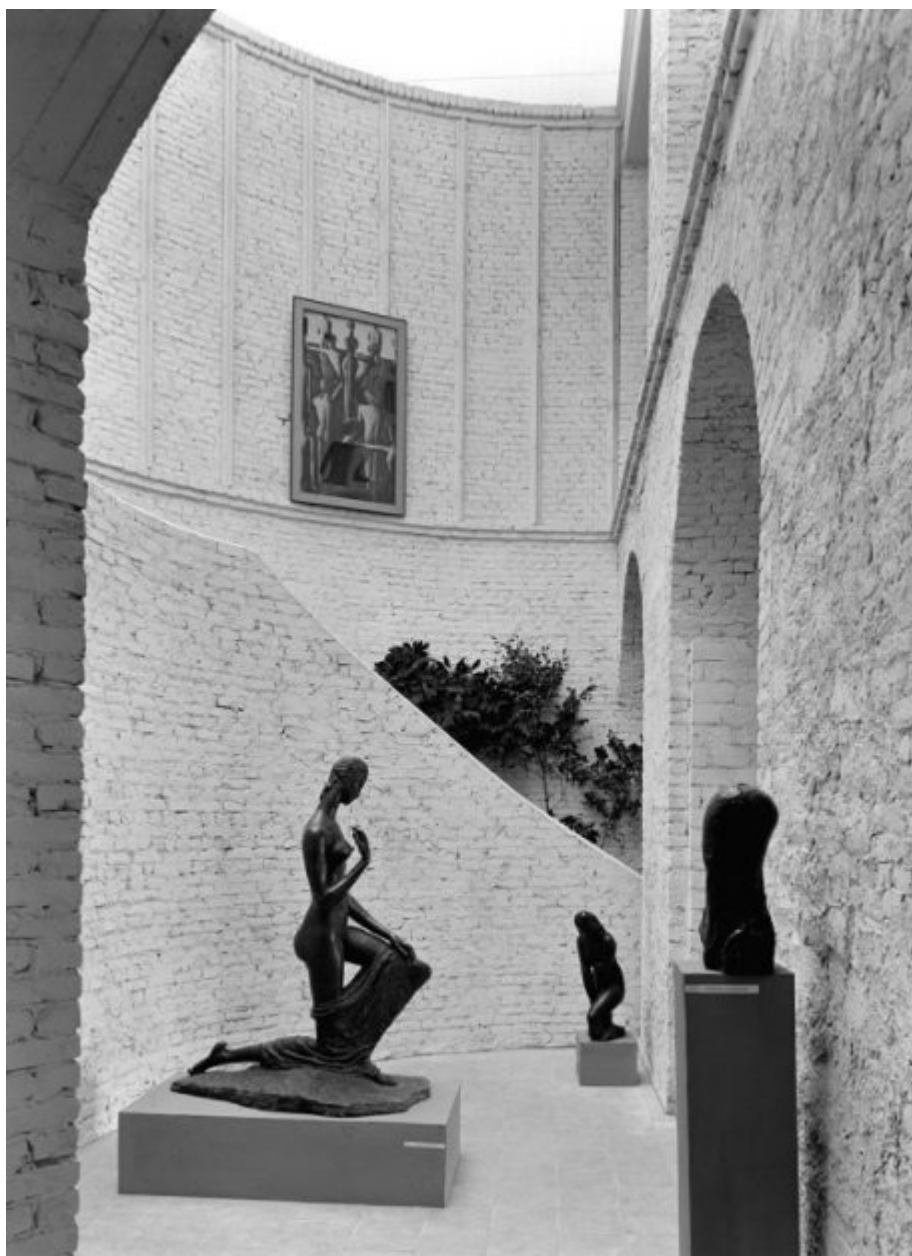
Το γλυπτό «Kneeling Woman» του Wilhelm Lehmbruck μέσα στο Μουσείο Fridericaneum

Σταδιακά η Documenta άρχισε να μεγαλώνει, να απλώνεται στην πόλη, να ελκύει όλο και περισσότερους επισκέπτες και να εξελίσσεται σε μία από τις μεγαλύτερες διοργανώσεις εικαστικών στην Ευρώπη αλλά και τον κόσμο. Το στίγμα της; Η πιο πολιτικοποιημένη απάντηση στη Μπιενάλε της Βενετίας με τα εθνικά περίπτερα.