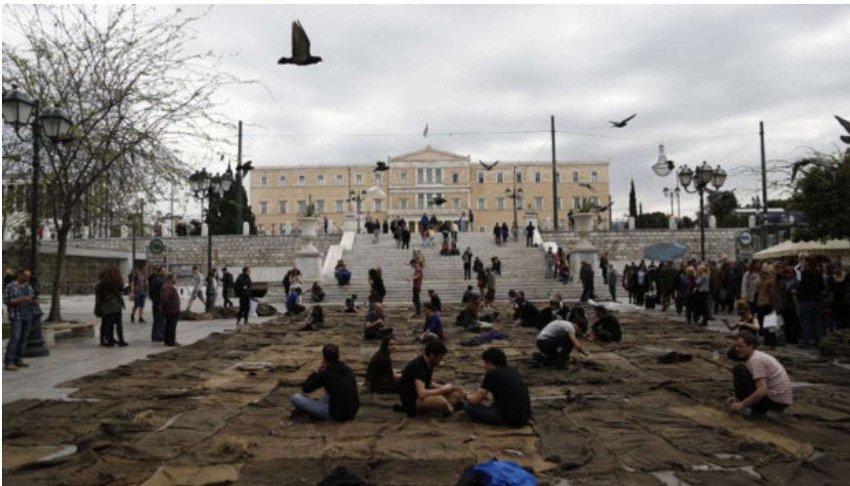
Περφόμανς του Ibrahim Mahama στην πλατεία Συντάγματος, στα πλαίσια της ανεπίσημης φάσης της Documenta 14, στις 16 Μαρτίου

Μια μικρή αναδρομή στο παγκόσμιο εικαστικό δρώμενο που εγκαινιάζεται στην Αθήνα στις 8 Απριλίου. Πώς γεννήθηκε και αναπτύχθηκε στο Κάσελ και πώς θα το μοιραστούμε τώρα με τη γερμανική πόλη.