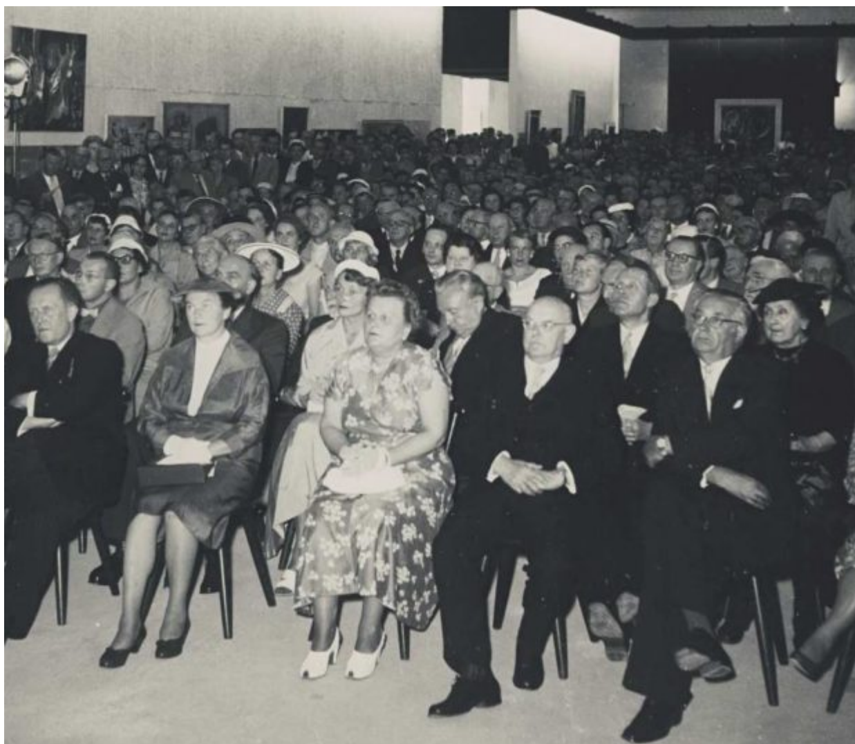
Τα εγκαίνια της πρώτης έκθεσης Documenta στο Κάσελ, το 1955

«Εκφυλισμένης τέχνης» -αυτός ήταν και ο τίτλος της έκθεσης που διοργάνωσε το ναζιστικό κόμμα στο Μόναχο το 1937. Ο αρχιτέκτονας και ζωγράφος είχε εντυπωσιαστεί από την έκθεση που είχε κάνει ο Πικάσο μαζί με ιταλούς αντιστασιακούς στο επίσης χτυπημένο από τον πόλεμο Palazzo Reale στο Μιλάνο το 1947 αλλά κυρίως από το «Armony Show» στη Νέα Υόρκη το 1913, την ιστορική έκθεση η οποία εισήγαγε κινήματα όπως ο κυβισμός και ο φωβισμός στην Αμερική της ρεαλιστικής αναπαράστασης. Αποφάσισε λοιπόν να κάνει κάτι αντίστοιχο στο Κάσελ.