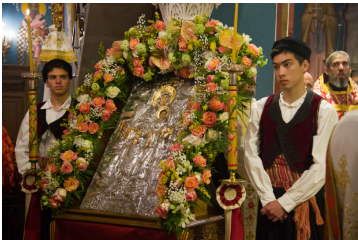
Εκ της Ιεράς Μητροπόλεως