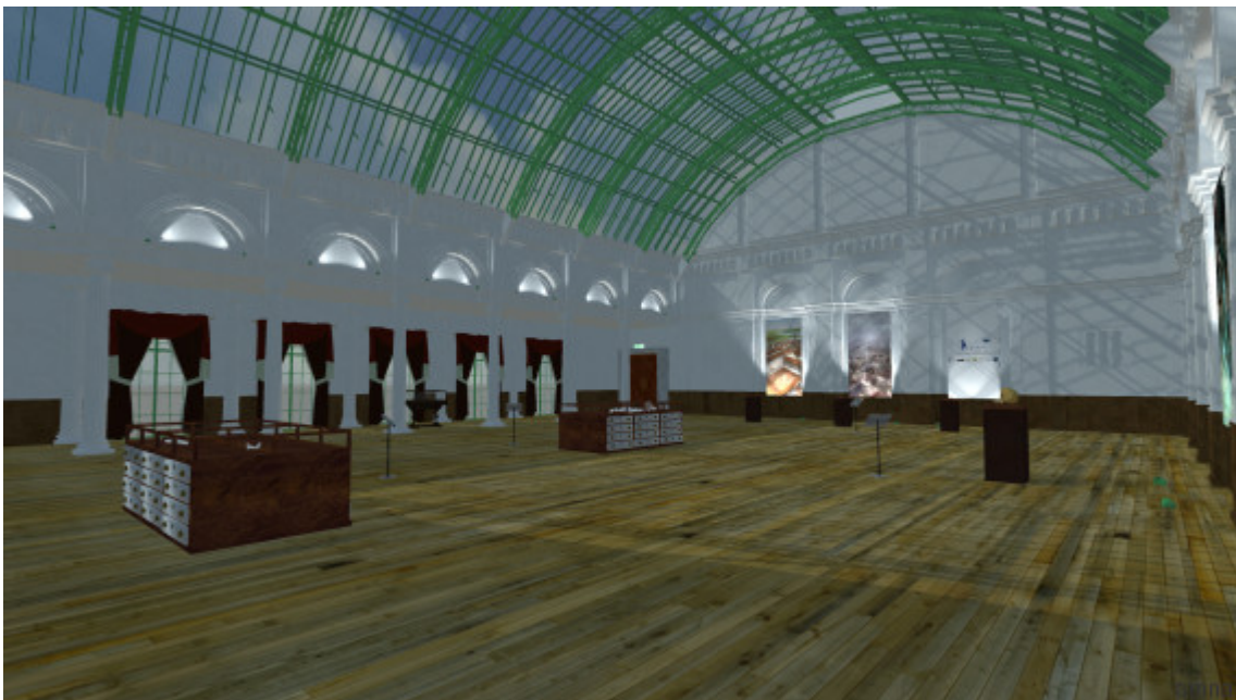
Το εικονικό μουσείο του Λίβερπουλ, όπου θα εκτεθούν οι συλλογές οστών

Για τη δημιουργία της ψηφιακής τρισδιάστατης περιήγησης στο βασιλικό ανάκτορο των Αιγών χρησιμοποιήθηκαν νέες ψηφιακές τεχνολογίες και μηχανές παιχνιδιών (τρειςδιάστατη σάρωση με εναέρια αυτόνομα αεροσκάφη drones, εναέριοι σαρωτές λέιζερ LIDAR, αυτόματη χαρτογράφηση και μοντελοποίηση δεδομένων, σημασιολογική ανάλυση εικόνων για τρισδιάστατες αναπαραστάσεις και οπτικοποίηση τρισδιάστατων σκηνών με επαυξημένη εικονική πραγματικότητα, που προσφέρει στους χρήστες νέα εμπειρία στην παρουσίαση των 3D μοντέλων). Χρησιμοποιήθηκε ακόμη η τεχνική της φωτογραμμετρίας, η στερεοσκοπική όραση, ενώ αναπτύχθηκε ανάλογο λογισμικό υποστήριξης.