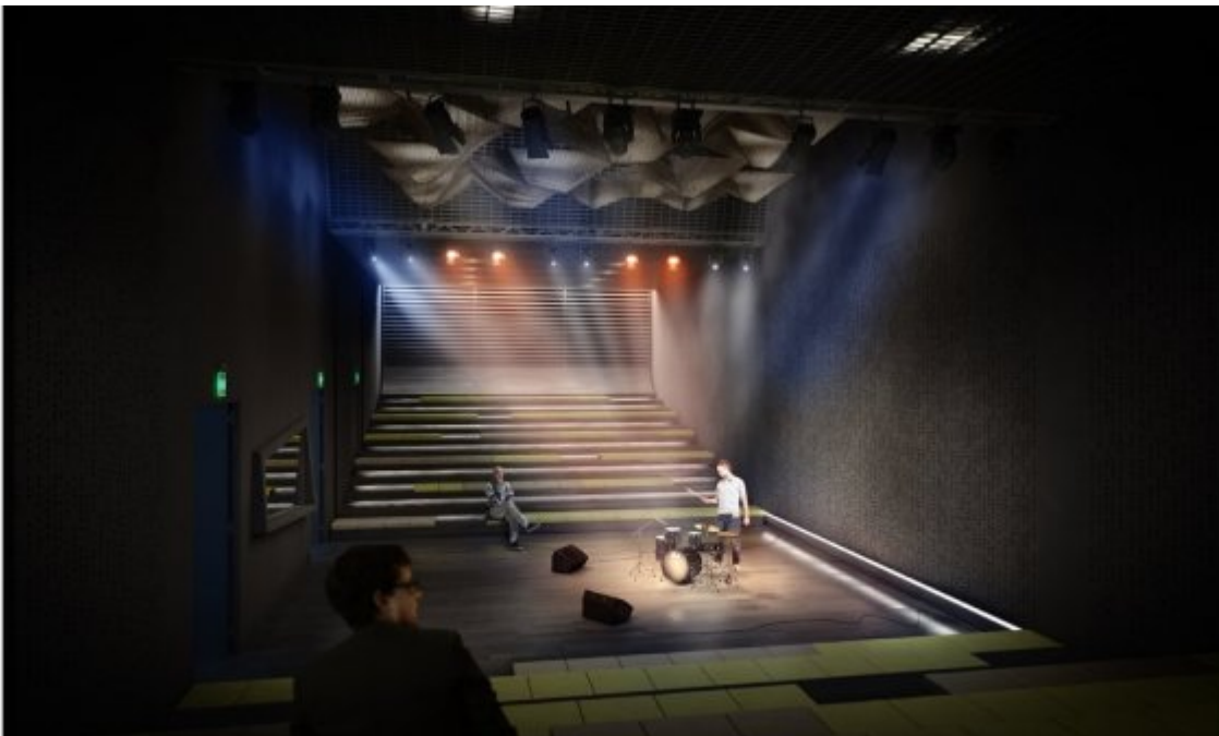
‘Black box’ δυναμικότητας 200 θέσεων με κατεύθυνση τον ηλεκτρονικό ήχο Κεντρική σκηνή με δύο αμφιθεατρικές ενότητες πτυσσόμενων καθισμάτων