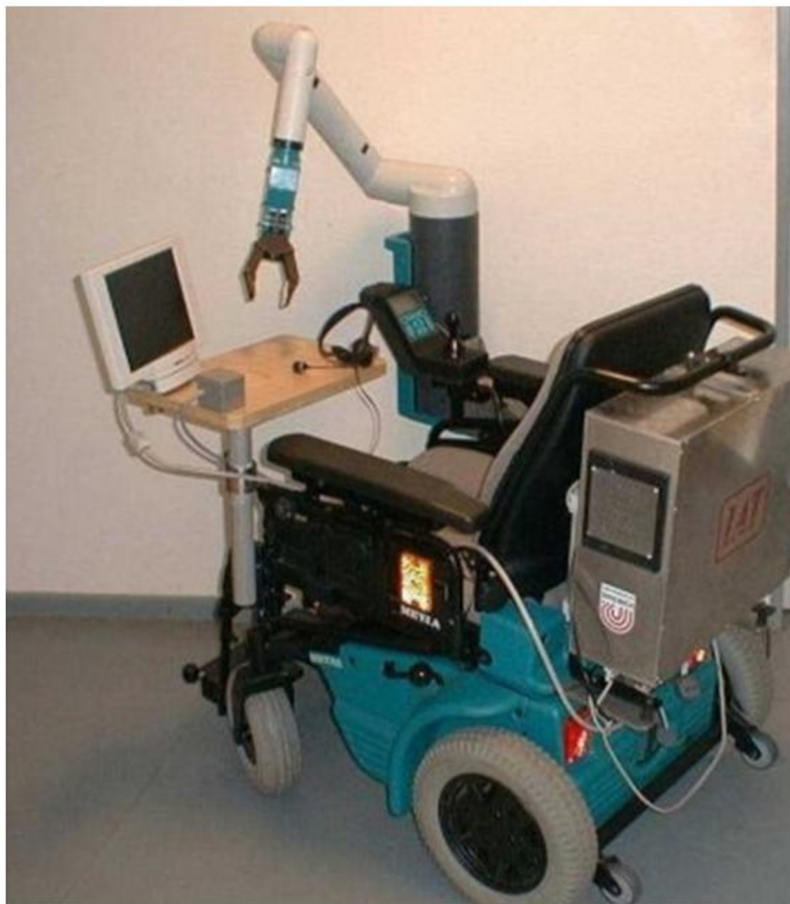
Αναπηρική αυτόνομη ρομποτική καρέκλα με βραχίονα εξυπηρέτησης.