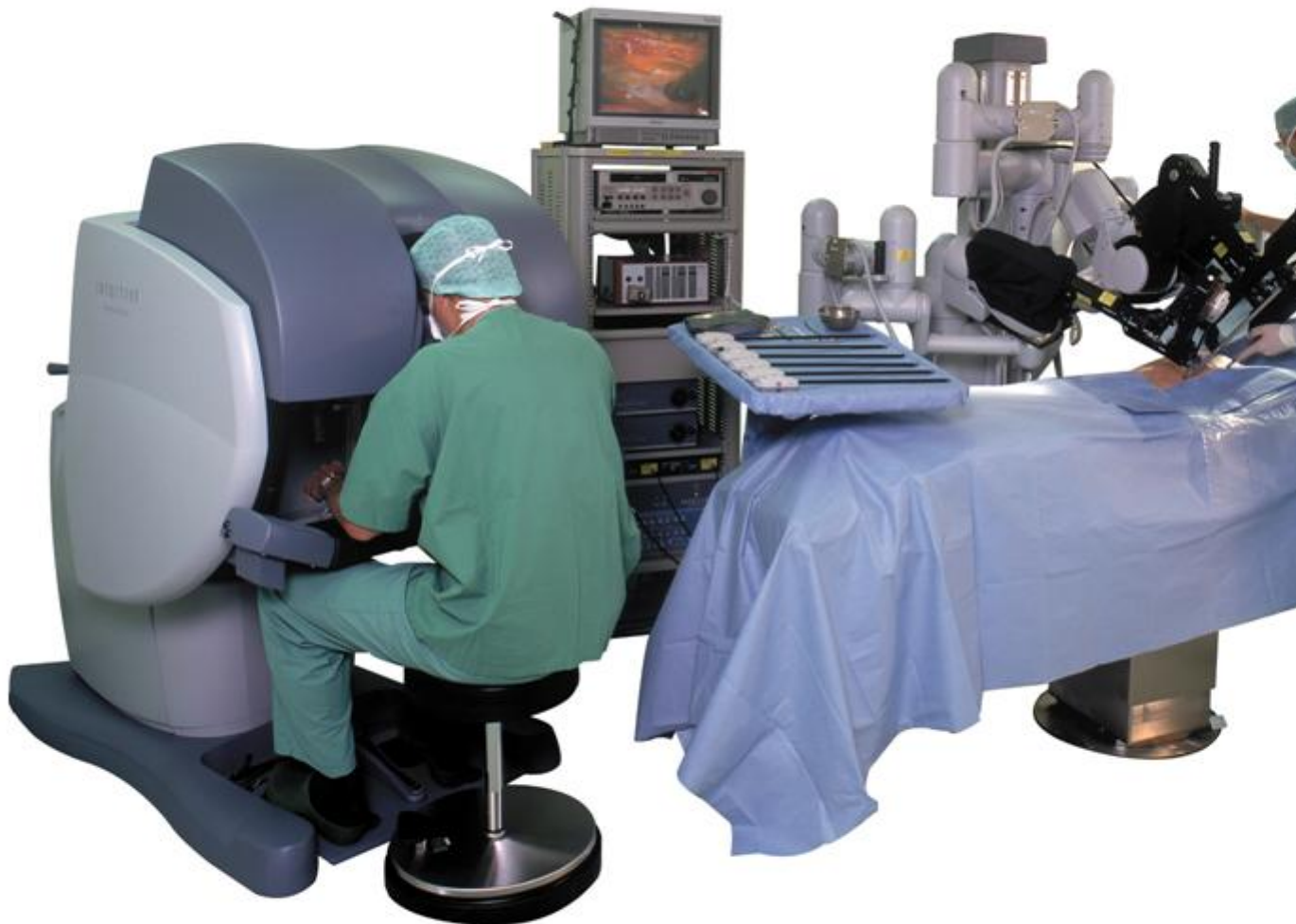
Το χειρουργικό ρομπότ Da Vinci (λειτουργούν πάνω από 2000 σε όλον τον κόσμο)

Τα ιατρικά ρομπότ διακρίνονται σε «μακρο-ρομπότ» (χειρουργικά ρομπότ, ρομπότ αποκατάστασης ΑΜΕΑ, αυτόνομες ρομποτικές καρέκλες) και «μικρο-ρομπότ» (για καθοδηγούμενη από εικόνες χειρουργική, ελάχιστης επέμβασης/ενδοσκοπική χειρουργική, αγγειοπλαστική, εμβολισμός (γέμισμα) εγκεφαλικών ανευρυσμάτων κ.α.). Τα ιατρικά ρομπότ ενισχύονται σημαντικά από τηλεχειριστές και εικονική πραγματικότητα, ιδιαίτερα όταν ο ασθενής δεν μπορεί να μεταφερθεί στον τόπο του ειδικευμένου χειρουργού (τραυματίες πόλεμου, ασθενείς απομακρυσμένων νησιών κ.λπ.). Ένα ιατρικό ρομπότ ευρείας χρήσης είναι το χειρουργικό ρομπότ Da