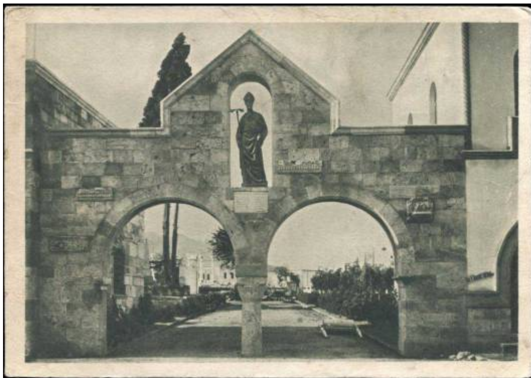
Φωτογραφία που εικονίζει την πύλη όπως ήταν πριν απομακρυνθεί το άγαλμα του Αγίου Νικολάου.

Η απόφαση των Ιταλών να επιλέξουν τον Άγιο Νικόλαο, και όχι κάποιον άλλο Άγιο, για την πύλη αυτή με προβληματίζει εδώ και καιρό. Χωρίς να γνωρίζω το σκεπτικό τους —θα είχε ενδιαφέρον να υπήρχε κάποιο σχετικό έγγραφο— ο νους μου πάει στην επιθυμία (για τους δικούς τους λόγους) να συνδυάσουν τις ενέργειές τους με την πηγαία ευσέβεια του λαού της Κω, ο οποίος σέβεται και τιμά ιδιαίτερα τον Άγιο Νικόλαο ανακηρύσσοντάς τον, μάλιστα, προστάτη και πολιούχο του νησιού. Προς επιβεβαίωση αυτής της δυναμικής παρουσίας του Αγίου στα πράγματα της Κω πρέπει να αναφέρουμε την καταστροφή υδροπλάνων του De Vecchi (Διοικητής Δωδεκανήσου κατά το διάστημα Δεκέμβριος 1936 - 1940) από μπουρίνι στα τείχη του Κάστρου της Νεραντζιάς, γεγονός που σύμφωνα με τις μαρτυρίες της εποχής έπαιξε καθοριστικό ρόλο στην απόφαση του ιταλού αξιωματούχου να επιτρέψει την ανέγερση του Ιερού Μητροπολιτικού Ναού του Αγίου Νικολάου στη νέα του θέση και να σταματήσει την μέχρι τότε παρελκυστική πολιτική με την οποία προσπαθούσε να αποφύγει την ανοικοδόμηση.