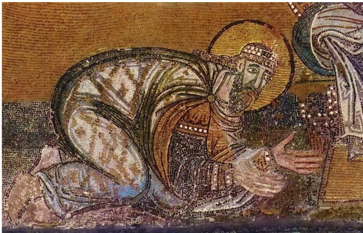
Λέων ΣΤ΄ ο Σοφός

Για την καταγωγή του Βασιλείου υπάρχουν μόνο ενδείξεις, και είναι ένα θέμα το οποίο έχει πολλές εκδοχές από την πλευρά των ιστορικών. Οι Αρμένιοι ιστορικοί Σαμουήλ του Ανί (12ος αι.) και Στέφανος του Ταρών (11ος αι.), αναφέρουν ότι ο Βασίλειος είναι Αρμένιος, από το χωριό Thil του Ταρών.[115] Με την αρμενική καταγωγή του Βασιλείου τάσσονται μεταξύ άλλων οι Ιωάννης Σκυλιτζής (11ος αι.),[116] Treadgold,[117] Vogt [118] και Settirani,[119] ενώ υπάρχει και η άποψη περί σλαβικής καταγωγής, που υποστηρίζεται από τον Bury,[120] τον Finlay [121] και τον Tobias,[122] όπως και από τους Άραβες ιστορικούς Isfahani [122, 123] και Tabari,[123] οι οποίοι χαρακτηρίζουν αυτόν και την μητέρα του «saqlabi», λέξη που χαρακτηρίζει τους Σλάβους, αλλά ο όρος αυτός αναφέρεται και για τους κατοίκους μεταξύ της Κωνσταντινουπόλεως και της Βουλγαρίας. Ο Vasiliev παραθέτει μια εναλλακτική λύση στο πρόβλημα, προτείνοντας την αρμενο - σλαβική καταγωγή, λόγω της ύπαρξης πολλών Σλάβων στην Μακεδονία την εποχή εκείνη, και την ανάμιξη του Βασιλείου με αυτούς.[124] Υπάρχει και η άποψη πως η καταγωγή του προέρχεται εκ πατρός από τον βασιλικό Οίκο των Αρσακιδών, και εκ μητρός από τον Μ. Κωνσταντίνο,[125, 126, 127, 128] ακόμα και τον Μ. Αλέξανδρο,[128] αναφορές πάντως που μάλλον δεν ευσταθούν, αφού ήταν συνηθής τακτική των Ελλήνων της εποχής εκείνης, να ανάγουν της καταγωγή των Αυτοκρατόρων σε ένδοξα και βασιλικά γένη.