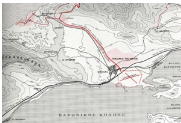
Σχέδιο Μεγαρίδος του κ.Μπίρη, λεπτομέρεια. Διακρίνεται ο νέος οικισμός της «Μεγαρίδος» αποκλειστικά για δημοσίους υπαλλήλους