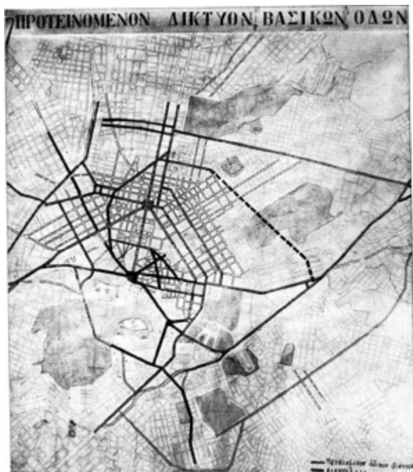
Διανοίξεις, πρόταση ΥΔΕ 1959, πηγή: Τεχνικά Χρονικά, σπ.παρ. Οι διανοίξεις ήταν η μόνη λύση στο πολεοδομικό και κυκλοφοριακό εκείνη την εποχή.