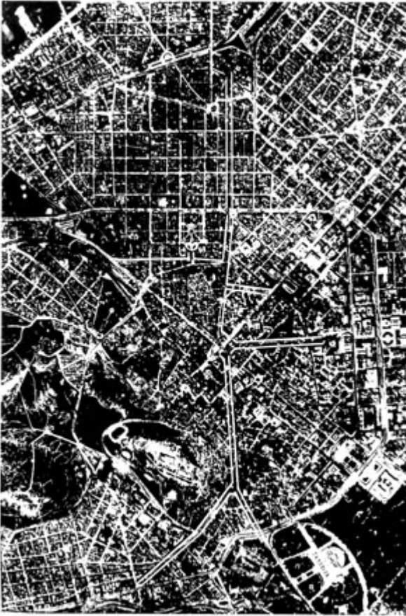
Διανοίξεις της πρότασης Καραντινού (Διοικήσεως Πρωτεύουσας) το 1940.

Διανοίξεις της Ανωτάτης Πολεοδομικής Επιτροπής, σχέδιο του Π.Καραντινού 1940 Προσπάθειες ενός αρχιτέκτονα να σχεδιάσει πολεοδομία, χωρίς ενιαία αντίληψη του χώρου και με εμμονή σε μικρολεπτομέρειες αλλά και σε διεθνή εργαλεία της εποχής, όπως οι διανοίξεις.