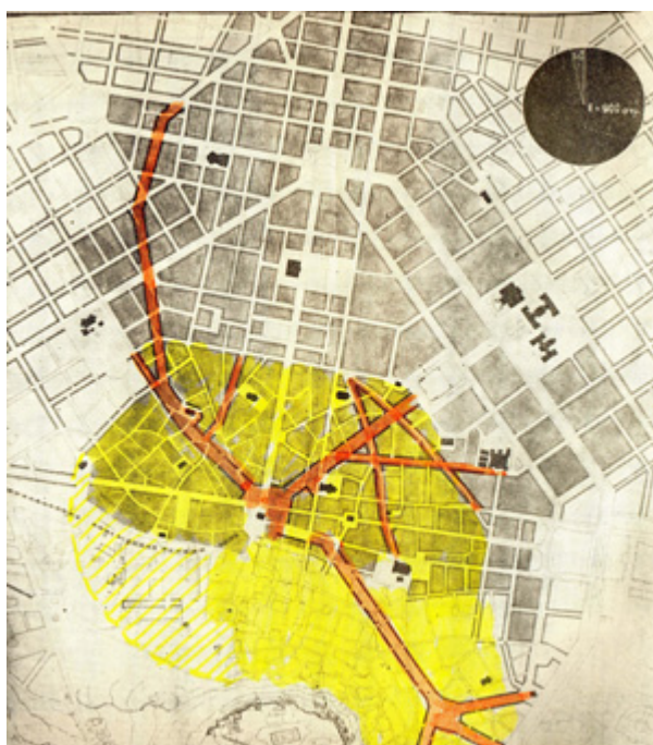
Διανοίξεις του ΥΔΕ 1959. εμπορικό κέντρο, πηγή : Τεχνικά Χρονικά, Γεν.Εκδ. 179-180/1959. Πολεοδομικές πρακτικές του Μεσοπολέμου (Martin Wagner για την Κωνσταντινούπολη το 1938). Διανοίξεις για τις διανοίξεις, πολλές δεν έχουν ούτε λογική καν.