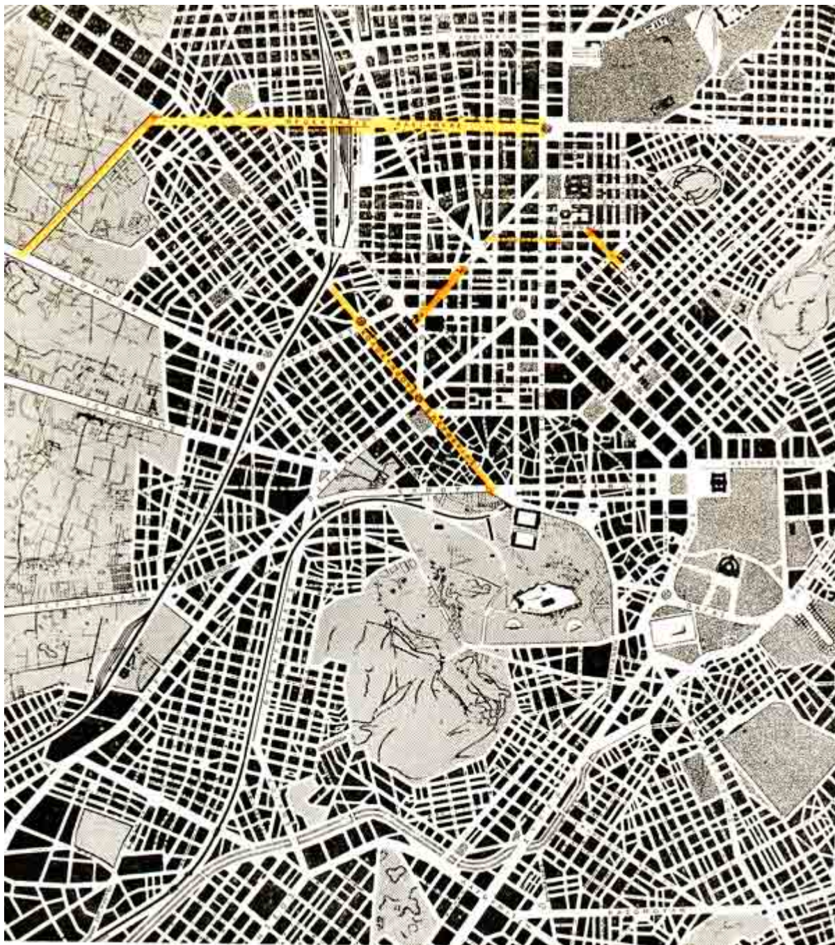
Διανοίξεις πρόταση Κ. Μπίρη 1959, πηγή : Τεχνικά Χρονικά , σπ.παρ. Ομοίως ως άνω!