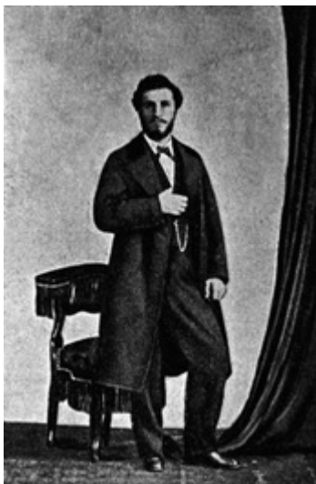
Ο εξερευνητής και ιατροφιλόσοφος Παναγιώτης Ποταγός σε νεαρή ηλικία

Τέλος, ο Παναγιώτης Ποταγός πέθανε πάμφτωχος «εις το βάθος και εν τη σιγή μιας ρομαντικής εξοχής εις το γραφικότατον χωρίον» Νύμφες («Νυφές») της Κέρκυρας, όπου πέρασε τα 17 τελευταία χρόνια της ζωής του. Εκεί, επέλεξε να προσφέρει δωρεάν τις ιατρικές του υπηρεσίες σε απλούς ανθρώπους («που τους γιάτρευε χάρισμα...») σαν άλλος Αλβέρτος Σβάιτσερ (1875 - 1965). Στο «Ημερολόγιον Σκόκου» (1904), σε σχετικό -μετά θάνατον- αφιέρωμα, αναφέρεται ότι: «Υπήρξε φιλόανθρωπος καθ' όλην την σημασίαν της λέξεως. Τίποτε δεν εκράτει δι' εαυτόν. Όταν επεσκέπτετο ως ιατρός πτωχούς ασθενείς, ου μόνον δεν έστεργε την ελάχιστην αμοιβήν αλλά κατέβαλλε και τα φάρμακα και τα προς περίθαλψιν χρειώδη».