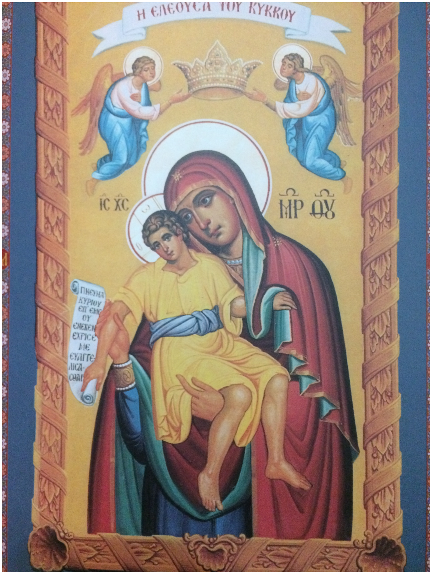
Η Εικόνα της Ελεούσης, που βρισκόταν στο Παλάτι της Κωνσταντινουπόλεως,