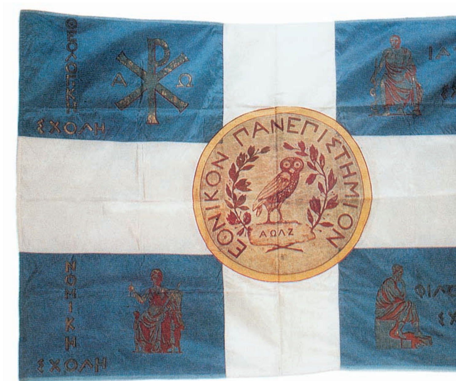
Η σημαία του Εθνικού Πανεπιστημίου

διαφωτισμού, και η οποία αποκρυσταλλώθηκε με την ιδρυτική πράξη του νέου κράτους. Ως εκ τούτου, το διάστημα των ετών 1837-1849 της ζωής του Κ. Σχινά τιτλοφορείται ως φάση της πρυτανείας και καθηγεσίας, διότι τοποθετήθηκε ευθύς εξ αρχής αφενός στο νευραλγικότερο διοικητικό αξίωμα, εκείνο του Πρύτανη του αρτισύστατου ιδρύματος, και αφετέρου στην πρώτη έδρα Ιστορίας της Φιλοσοφικής Σχολής.