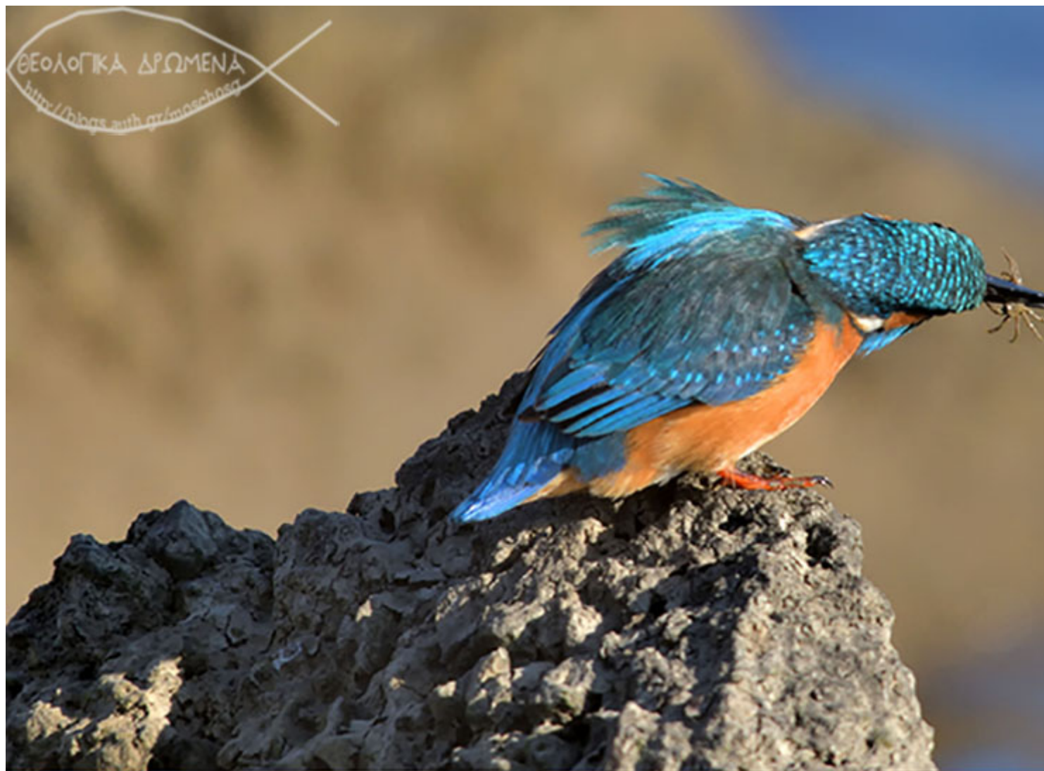
Αλκυόνη, εκβολές Γαλλικού, Δεκέμβριος 2016

επιτρεπόμενα είδη θεωρούνταν καθαρά και τα απαγορευμένα ακάθαρτα. Ο διαχωρισμός αυτός μαρτυρείται από το πρώτο βιβλίο της Π.Δ. στις οδηγίες που δίνονται στο Νώε (Γεν. 7:2). Οι διατροφικοί κανόνες με το πέρασμα του χρόνου έγιναν εξαιρετικά περίπλοκοι προκειμένου να καλύψουν όλες τις περιπτώσεις που θα αντιμετώπιζε ο πιστός Ιουδαίος και έτσι αργότερα ένα μεγάλο μέρος του Ταλμούδ αφιερώνεται σε αυτούς.