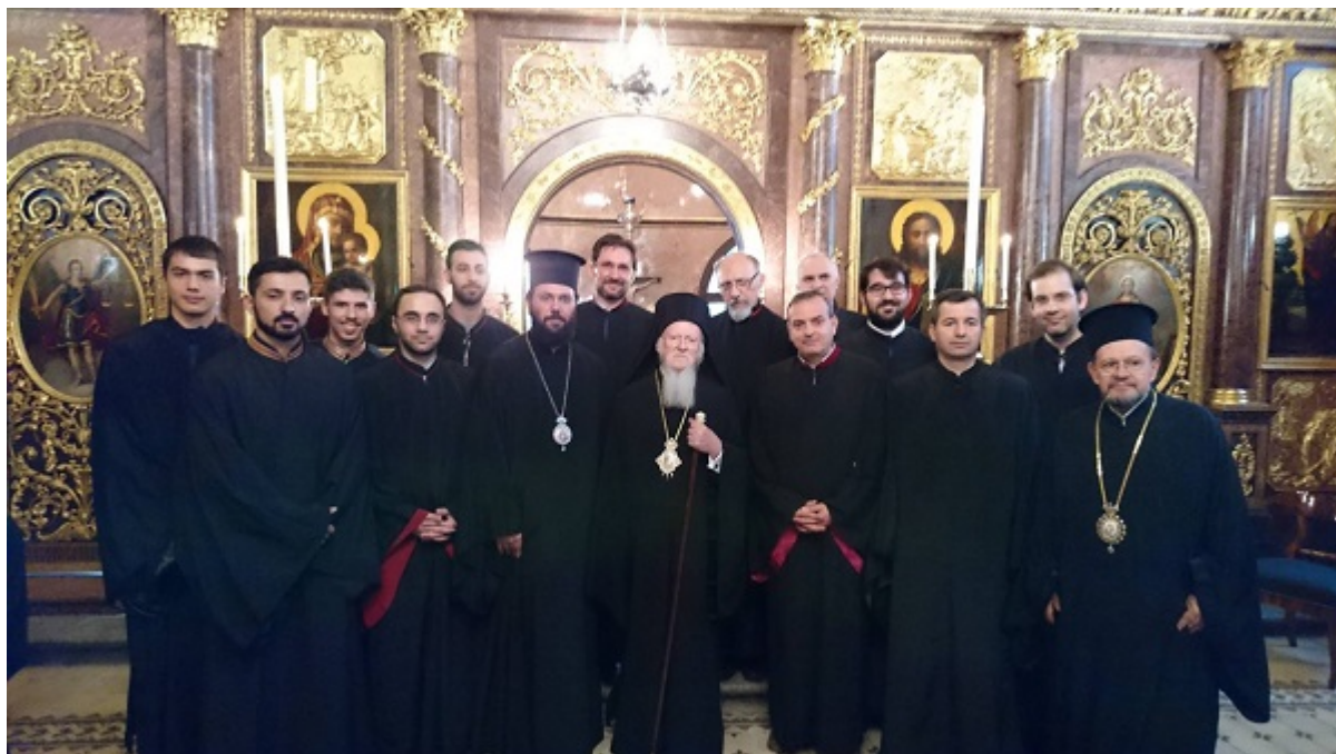
Με την ΑΘΠ τον Οικουμενικό Πατριάρχη κ. Βαρθολομαίο, τον Σεβ. Μητροπολίτη Αυστρίας κ. Αρσένιο και μέλη του Βυζαντινού Χορού Ιεροσαλτών, σε εκδήλωση στην Ιερά Μητρόπολη Αυστρίας.

Ευχόμαστε ολόψυχα ο Πανάγαθος Θεός να χαρίζει στον νέο Κοσμήτορα πλουσιοπάροχα τη Θεία Χάρη Του και στην επιτέλεση των νέων καθηκόντων του.