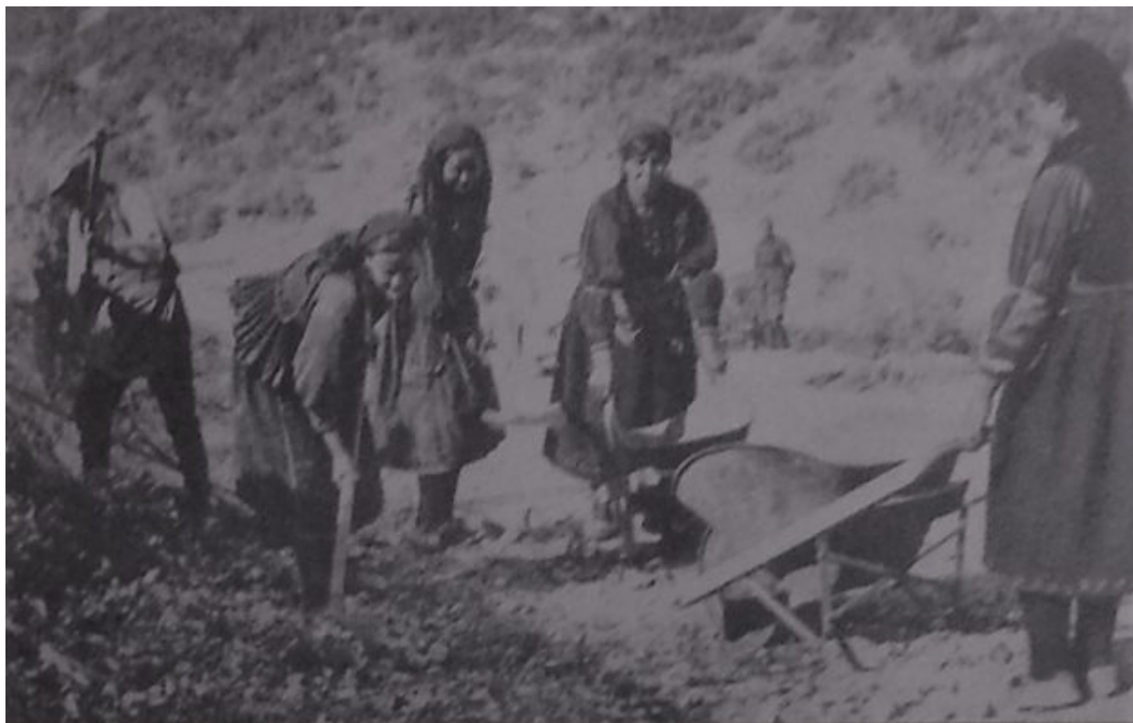
Διάνοιξη δρόμου από Ηπειρώτισσες