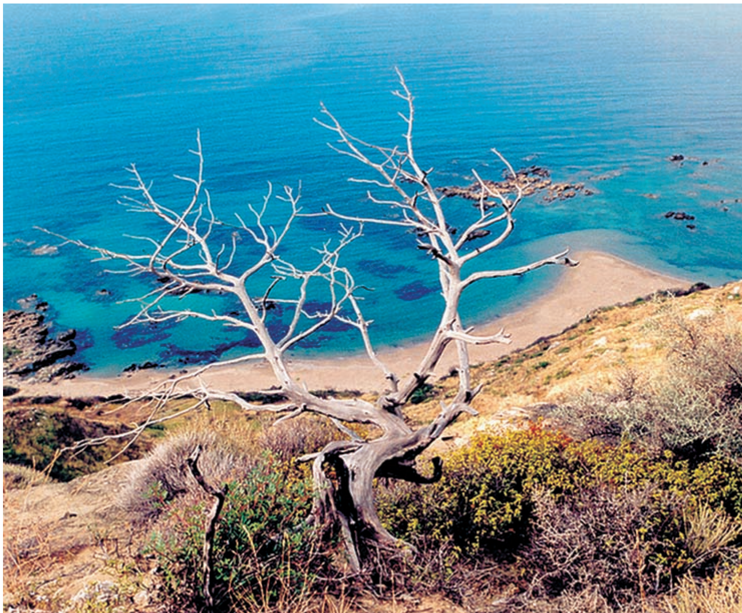
Η παραλία των Σεκανίων αποτελεί τη σημαντικότερη παραλία ωτοκίας για την Caretta caretta στη Μεσόγειο.

Το WWF Ελλάς, μετά την αγορά της έκτασης συνέταξε σχέδιο προστασίας για την περιοχή, το οποίο εφαρμόζει, για να προσεγγίσει ολοκληρωμένα την προστασία του οικοσυστήματος της περιοχής. Αξιοσημείωτο είναι ότι στα πλαίσια συνεργασίας με το ΕΘΠΖ συνεχίζεται η εφαρμογή του και μετά την ίδρυση του Πάρκου.