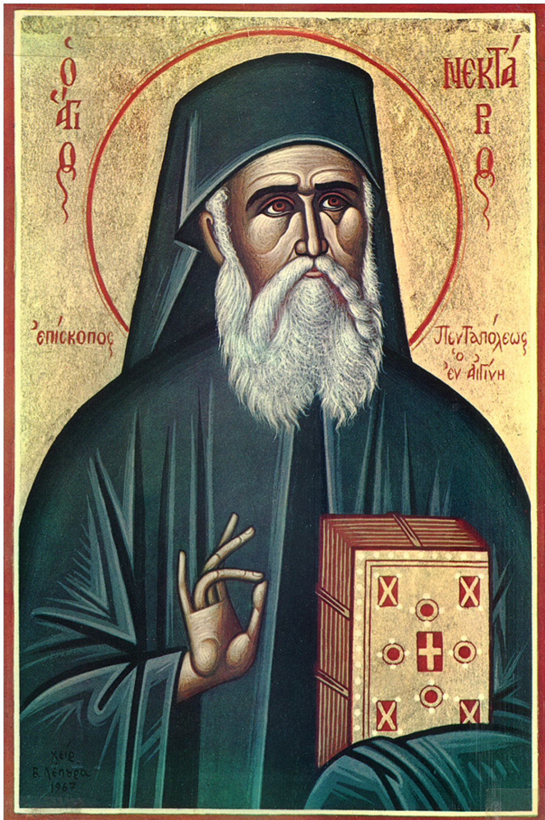
ΣΤΡΟΦΗ ΠΡΟΣ ΤΑ ΜΟΝΑΣΤΗΡΙΑ