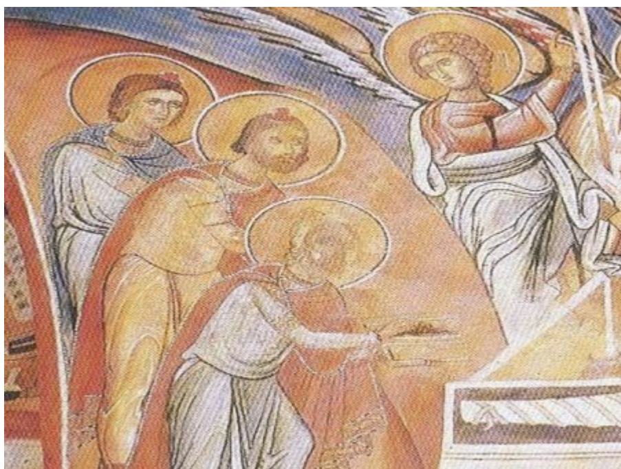
Επιπλέον αριστερά της

εικόνας, κοντά στο θείο βρέφος, διακρίνουμε την παρουσία των μάγων οι οποίοι εικονίζονται πεζοί με διαφορετική ηλικία, νέος, μεσήλικας και γέροντας. Ο πρώτος με λευκή κώμη, ο δεύτερος γενειοφόρος και ο τρίτος αγένειος. Στα χέρια τους κρατούν δώρα τα οποία θα προσφέρουν στον μικρό Χριστό. Μπροστά τους είναι το αστέρι, το μήνυμα που στάλθηκε από τον ουρανό για να τους οδηγήσει στον αναμενόμενο λυτρωτή. Το διαφορετικό της ηλικίας των μάγων υποδηλώνει ότι ο Χριστός φωτίζει όλους τους ανθρώπους ανεξάρτητα από την ηλικία τους. Οι μάγοι, οι αιώνιοι αναζητητές της αλήθειας είναι αστρολόγοι, βασιλιάδες και ιερείς, είναι οι σοφοί και διαβασμένοι κάθε εποχής, που όμως η γνώση τους δεν στέκει εμπόδιο για να προσκυνήσουν τον Χριστό και να τον αναγνωρίσουν ως σωτήρα και Θεό. Τα δώρα τους ο χρυσός, το λιβάνι και η σμύρνα είναι δογματικά στοιχεία τα οποία προσφέρονται στο Χριστό όπως διακρίνεται και στην παράσταση. Το χρυσάφι το προσφέρουν στον βασιλιά, το λιβάνι γιατί είναι Θεός και τη σμύρνα γιατί είναι το υλικό με το οποίο άλειψαν τους νεκρούς, κατά την εβραϊκή παράδοση. Η άλειψη, η χρίση των νεκρών, γινόταν για λόγους καθάρσεως, σύμφωνα με την ορθόδοξη πίστη, πλένοντας τους νεκρούς πριν τους θάψουμε. Τον Χριστό τον άλειψαν με σμύρνα και αλόη. Άρα είναι Θεός, είναι βασιλιάς και είναι αυτός ο οποίος θα πεθάνει για εμάς. Οι μάγοι αντιπροσωπεύουν τους ειδωλολάτρες που θα αποτελέσουν την προερχόμενη εκκλησία από τους Εθνικούς.