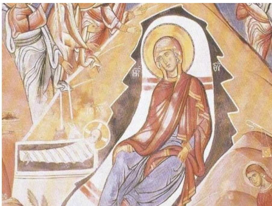
Αρχικά στην παράσταση

αυτή, η μορφή που υπερτερεί είναι η Θεοτόκος που εικονίζεται στο κέντρο της, τυλιγμένη σεμνά στο κόκκινο μαφόριό της, ενώ η κεφαλή της περιβάλλεται με φωτοστέφανο και εμφανίζεται μισοξαπλωμένη και μισοκαθισμένη δίπλα στο μικρό Χριστό, σε ανάλαφρη στάση, για να υποδηλωθεί η απουσία του πόνου και συνεπώς η Παρθενική γέννηση του Χριστού. Στο πρόσωπο της Παναγίας διακρίνεται λύπη που μας παραπέμπει στους λόγους του προφήτη Συμεών κατά τον Σαραντισμό του Κυρίου: «σου δεν την ψυχήν διελεύσεται ρομφαία». Η Θεοτόκος στο λευκό της στρώμα ανακαθισμένη στο σκοτεινό άνοιγμα του σπηλαίου παραθέτει το σύμβολο της ενσάρκωσης στο μεγαλείο του Χριστού, με το φως της Ανάστασης στο ιμάτιο της.