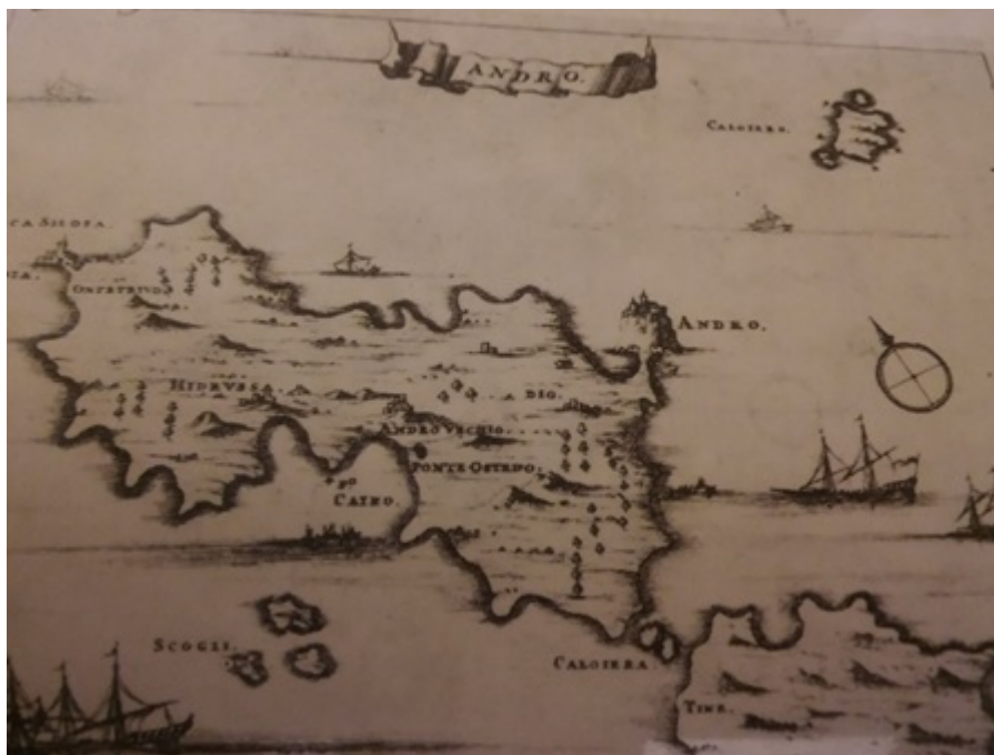
Στο συγκεκριμένο χάρτη φαίνεται το νησί Calojero, ΒΑ της Άνδρου (Dapper, Amsterdam, 1690)