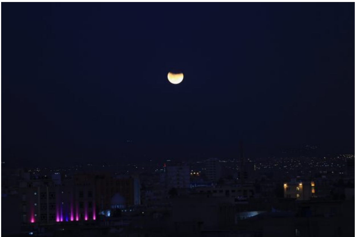
epa06488552 The supermoon passes out of the earth's shadow during a lunar eclipse as a super blue blood moon sets over the downtown Erbil City, Kurdistan Region, Iraq, 31 January 2018. The previous 'Supermoons' appeared on 03 December 2017 and on 01 January 2018. A 'Supermoon' commonly is a