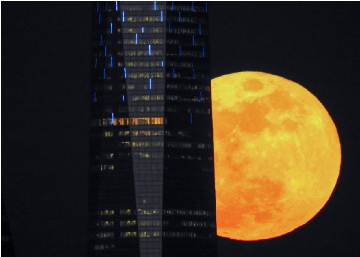
A full moon «supermoon» rises next to a skyscraper in Madrid, Spain, January 31, 2018.