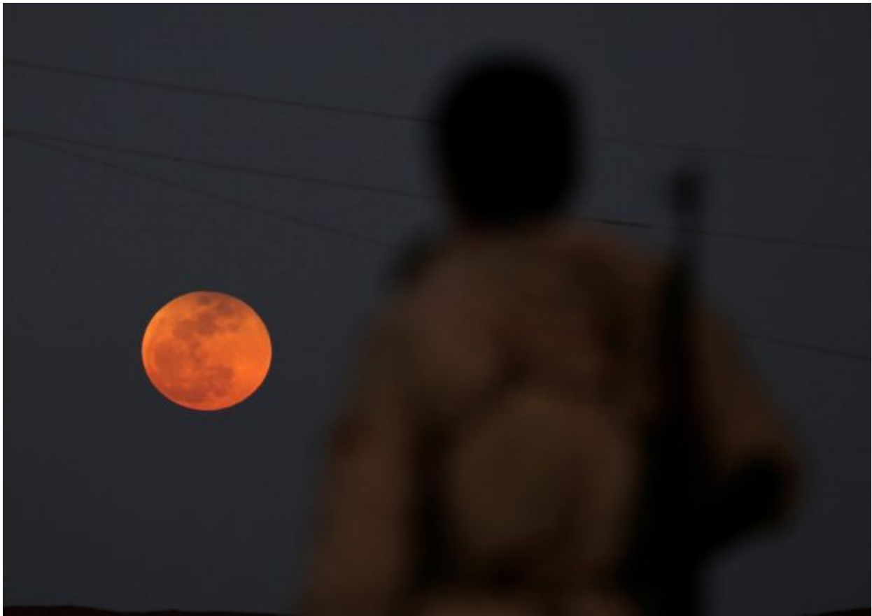
A fighter from Free Syrian Army is seen watching a full moon rises in Daraa, Syria January 31, 2018.