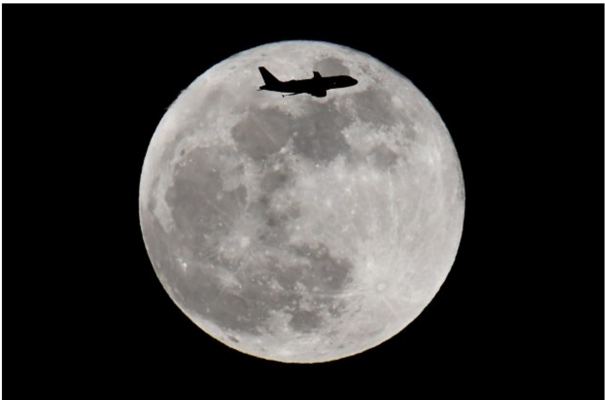
A passenger plane flies in front of a supermoon full moon over London, Britain, January 31, 2018.