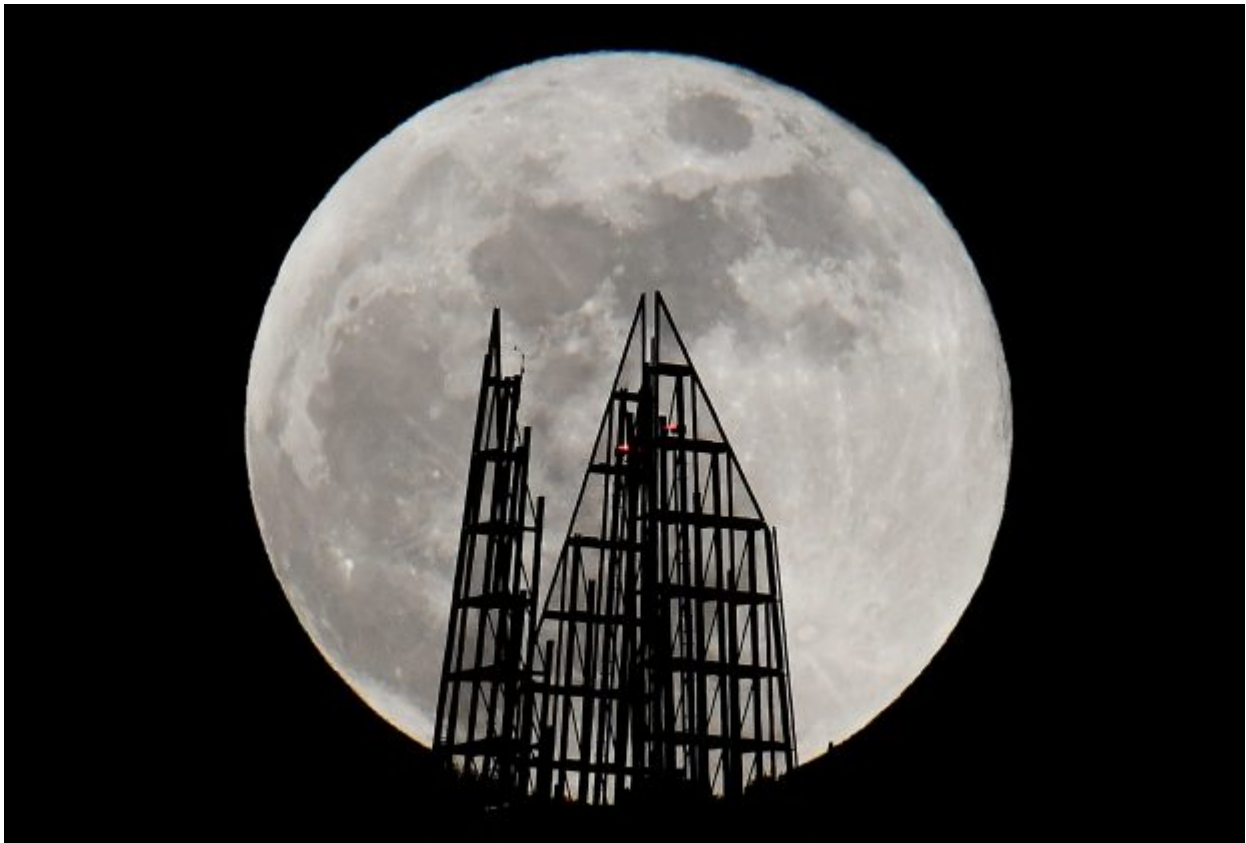
A supermoon full moon is seen behind the Shard skyscraper in London, Britain January 31, 2018.