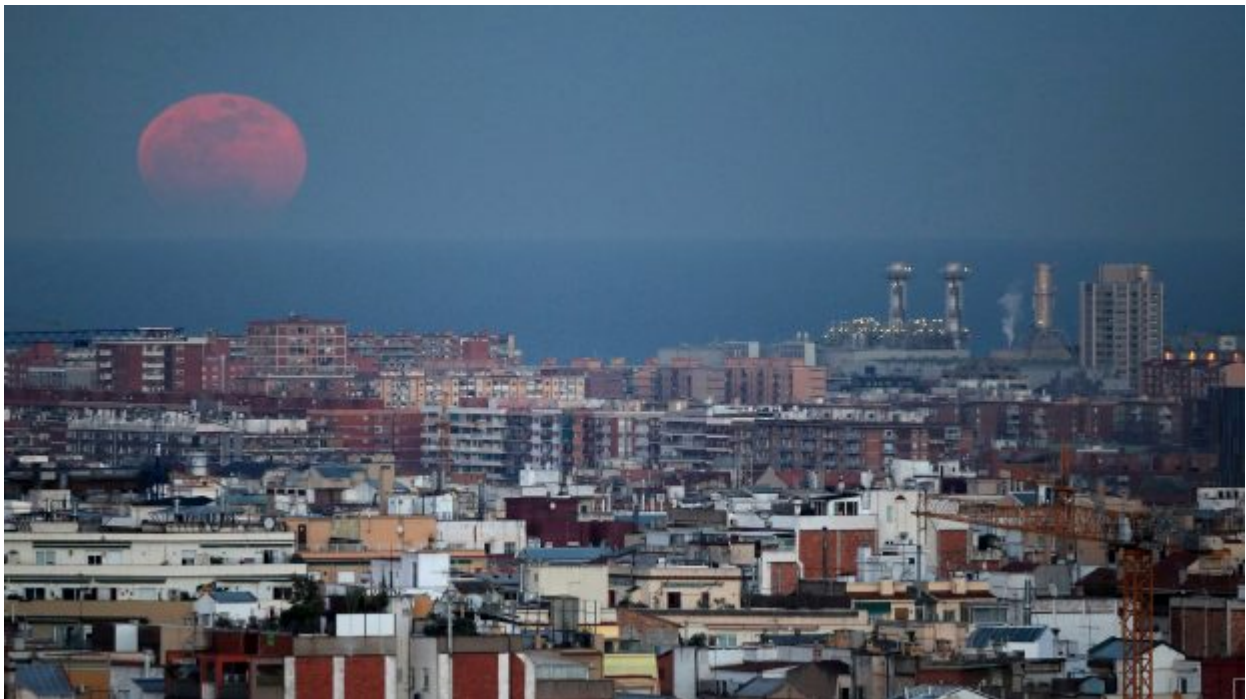
A full moon «Super Blue Blood Moon» rises behind Mediterranean sea in Barcelona, Spain January 31, 2018.