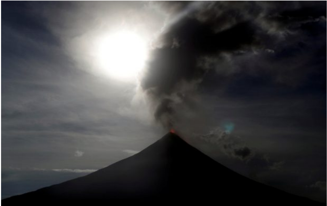
The super blue moon rises above the spewing Mayon Volcano during a mild eruption before a total lunar eclipse in Legazpi, Philippines, January 31, 2018. REUTERS/Erik De Castro TPX IMAGES OF THE DAY