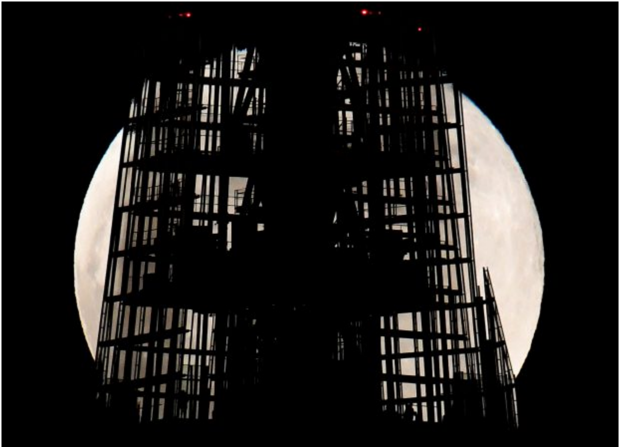
Silhouettes of people are seen looking out from the Shard skyscraper with a full moon «supermoon» seen behind in London, Britain January 31, 2018.

which is a supermoon, but also a lunar eclipse, all rolled into one celestial phenomenon.