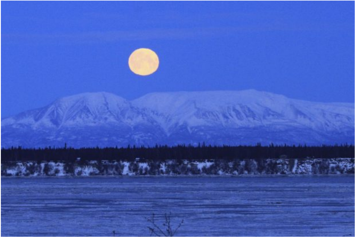
The moon sets over Mount Susitna, known locally as Sleeping Lady, across Cook Inlet on Wednesday, Jan. 31, in Anchorage, Alaska.