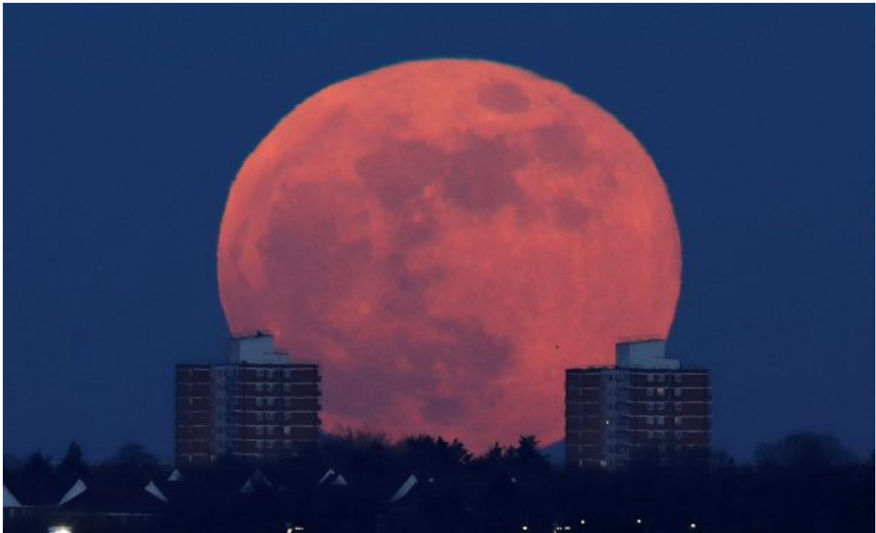
A full moon rises behind blocks of flats in north London, Britain, January 31, 2018. REUTERS/Eddie Keogh TPX IMAGES OF THE DAY