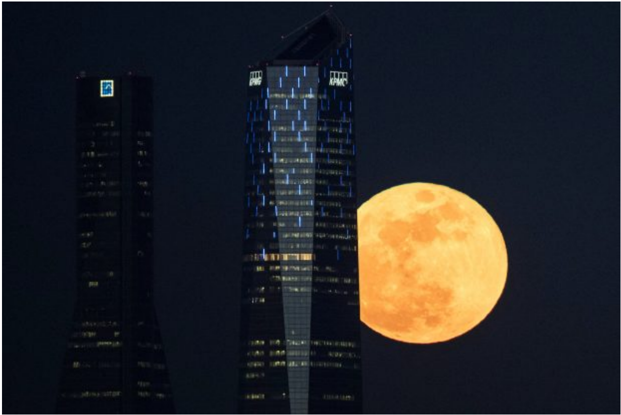
A full moon «supermoon» rises between skyscrapers in Madrid, Spain, January 31, 2018.

right, the largest mosque in Asia Minor, as the supermoon rises over Istanbul, Wednesday, Jan. 31, 2018. On Wednesday, much of the world will get to see not only a blue moon which is a supermoon, but also a lunar eclipse, turning the moon blood red, all rolled into one celestial phenomenon.